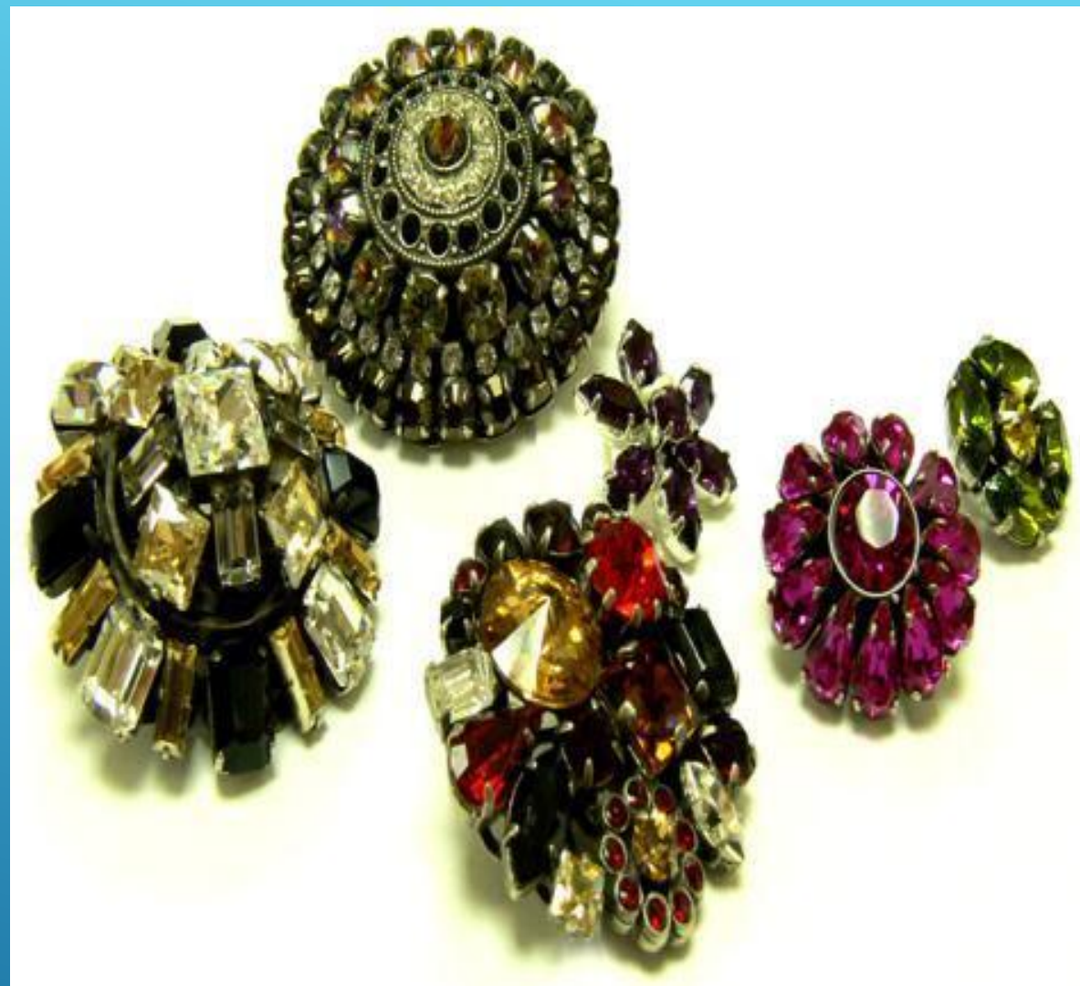
Пуговицы из драгоценных камней: золота и серебра.