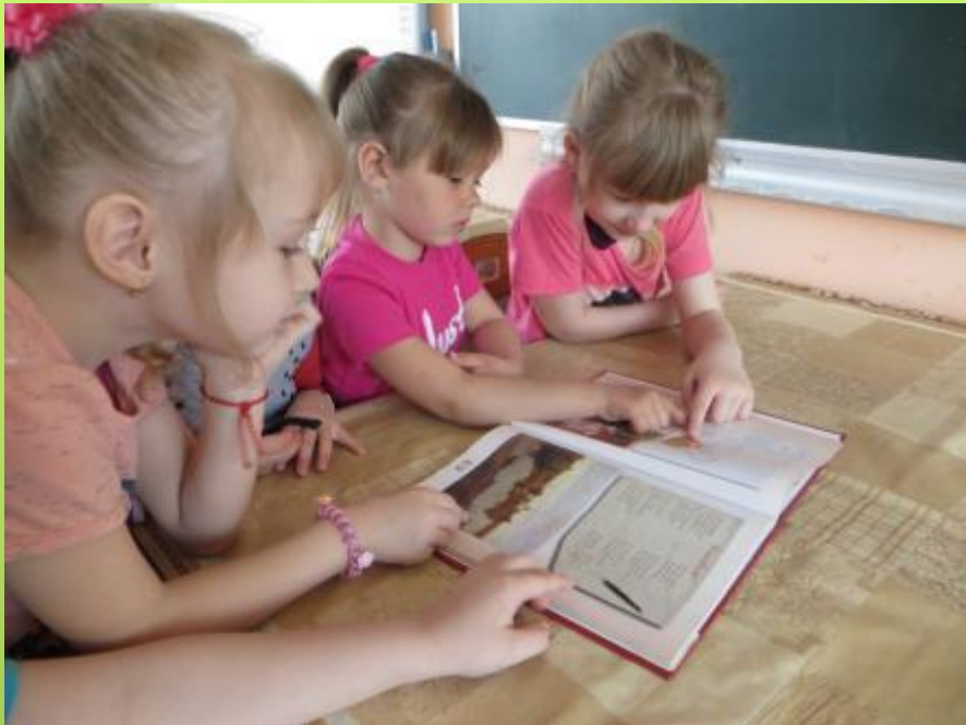
Старшая – подготовительная группа