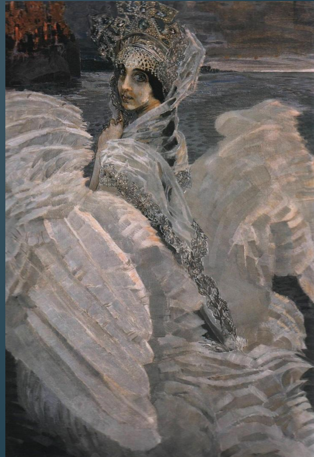
М. А. Врубель. Царевна - Лебедь