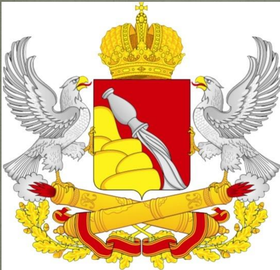
Герб Воронежской Области