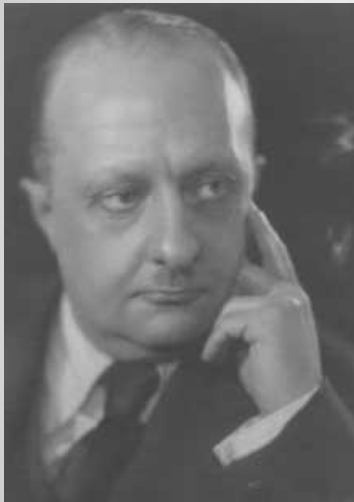
Тур Александр Фёдорович