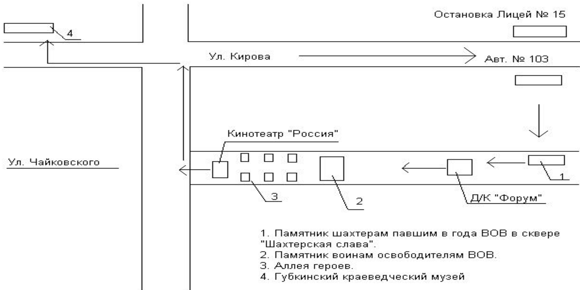
Схема экскурсионного маршрута "Семейный поход" в г.Губкин