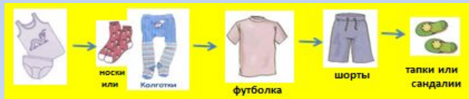
Алгоритм одевания мальчиков в группе