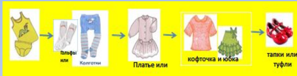
Алгоритм одевания девочек в группе