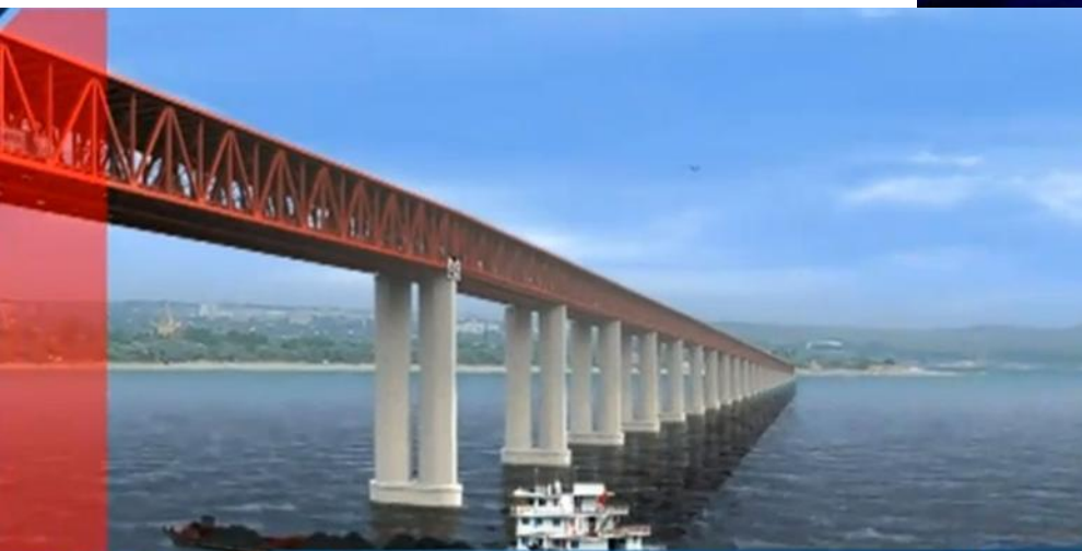
Мост через Керченский пролив