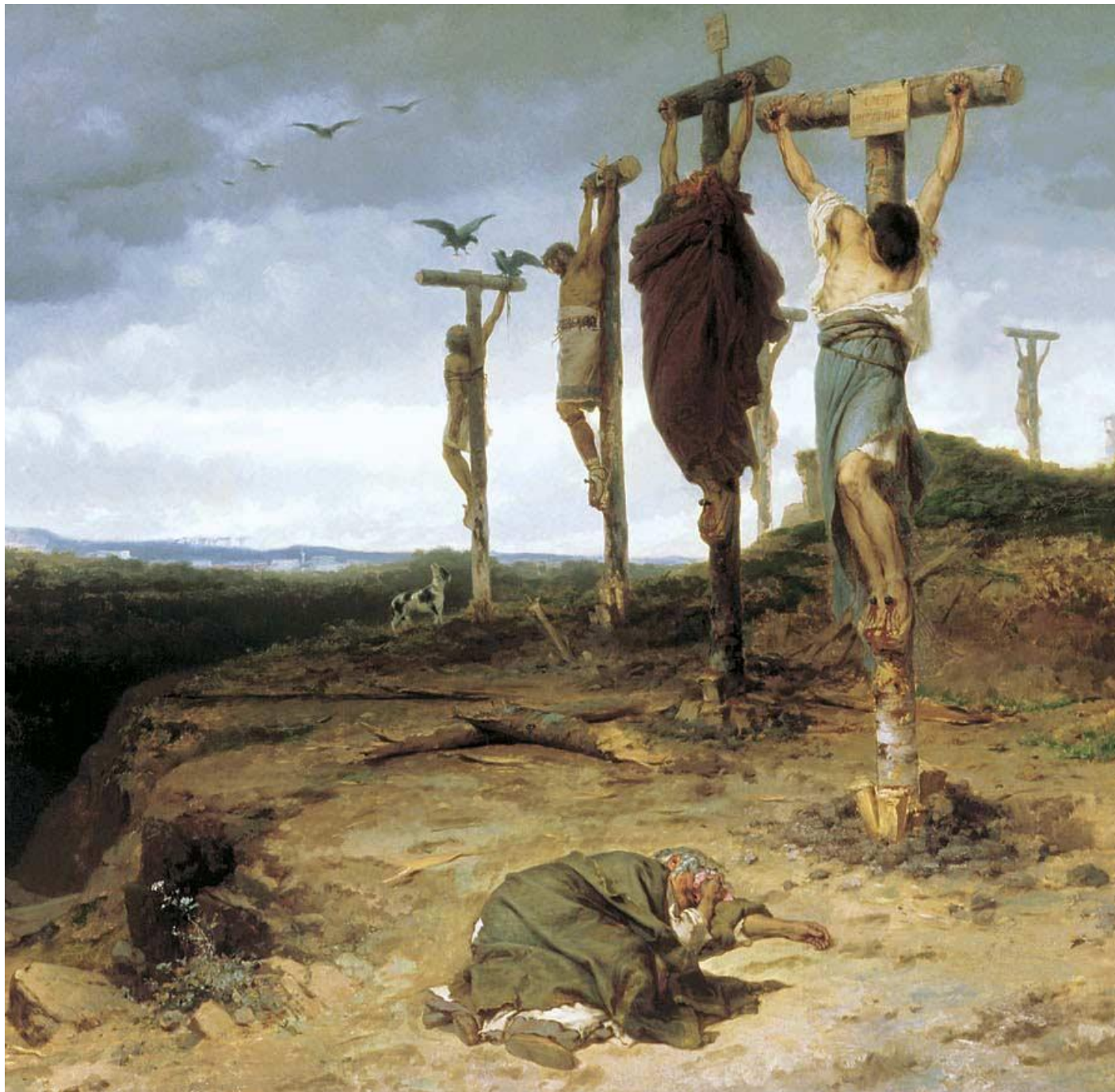
РАСПЯТЫЕ РАБЫ В ДРЕВНЕМ РИМЕ. КАРТИНА Ф. БРОННИКОВА, 1879