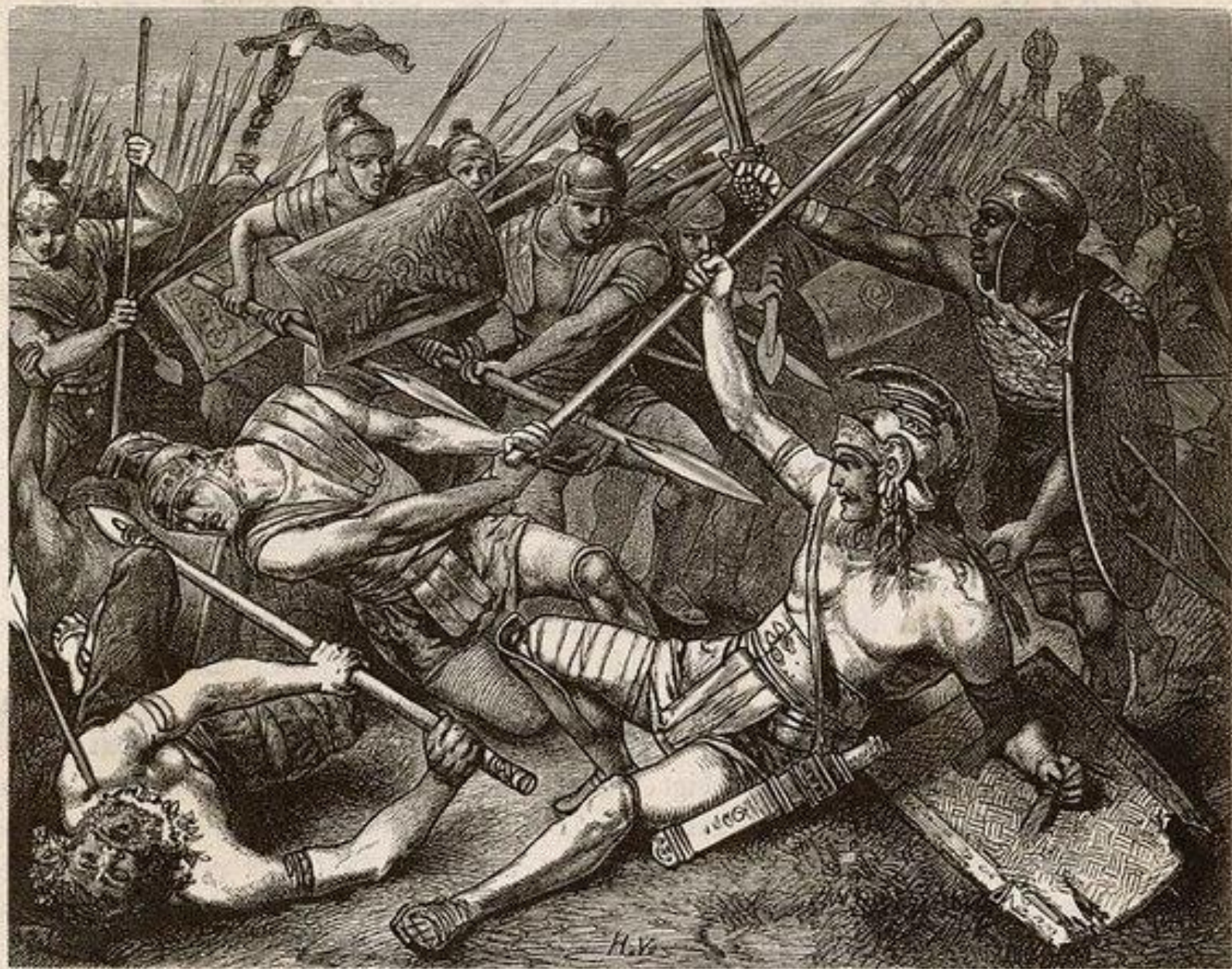
Tod des Spartacus. Zeichnung von Hermann Vogel.