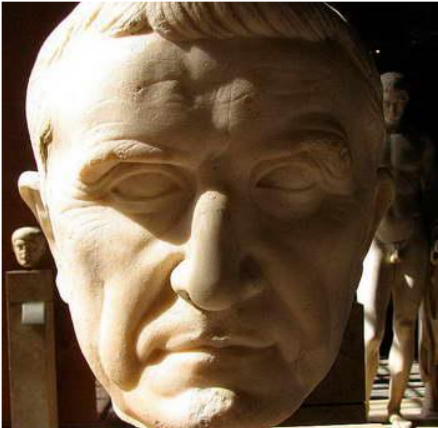
МАРК ЛИЦИНИЙ КРАСС