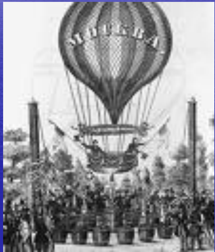
Один из братьев Монгольфье