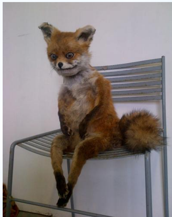
Всем известная “упоротая лиса”

Наркотики - вещества, действующие на человеческий организм в виде наркотического опьянения и обладающие характерными побочными эффектами. Они вызывают привыкание, как психологическое, так и физическое. В перерывах между их приемами, у наркомана возникает болезненное состояние, так называемая, ломка.