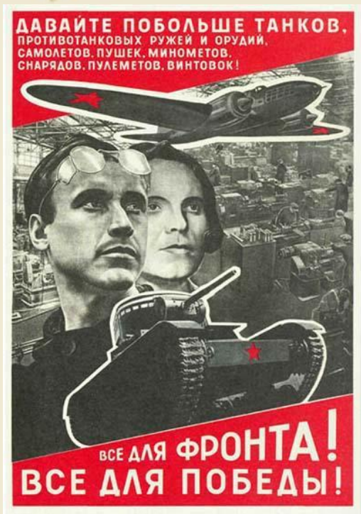
Лисицкий Л. «Все для фронта! Все для победы!»

Плакат был отпечатан после смерти автора зимой 1941 – 1942 года. Плакат обращен к рабочим предприятий советской страны со словами: "Давайте побольше танков, противотанковый ружей и орудий, самолетов, пушек, минометов, снарядов, пулеметов, винтовок!" На плакате изображены лица рабочих - мужчины и женщины, в центре плаката. Там же летящий самолет идвигающийся танк, за ними - мирный город. Тем самым автор плаката показывает, что освобождение страны и приближение победы зависит от их трудовых свершений и количества необходимой военной техники, изготовленной ими и поставленной фронту.