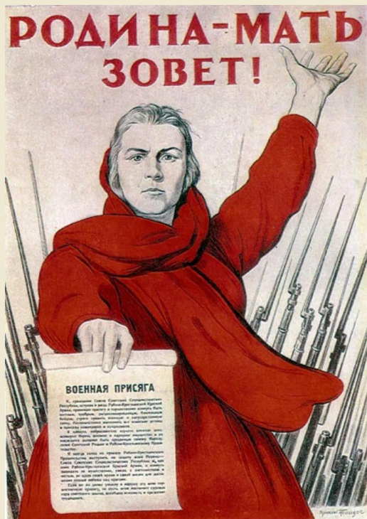
Тойдзе И.М. «Родина-Мать зовет!»

Лето. 1941 год. Конец июня. От Белорусского вокзала уходят на фронт военные эшелоны.