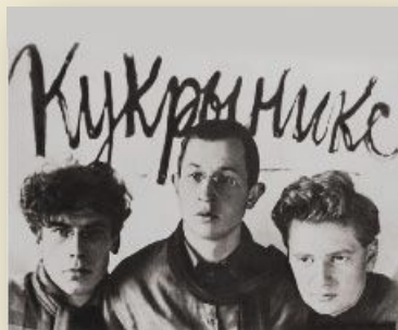
Кукрыники "Беспощадно разгромим и уничтожим врага!"