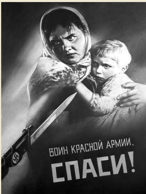
Корецкий В. «Воин Красной Армии, спаси!»

Трагическая сила образа Призывом к мщению звучал плакат 1942. Не было не только ни одного бойца, но, кажется, ни одного человека, кого бы не пронзила трагическая сила этого образа женщины, в ужасе прижавшего к себе ребёнка, на которого направлен штык со свастики. Это произведение вызывало особенную ненависть у солдат Красной Армии к врагу. Плакат сделан в двух цветах - черном и красном, притом красный - только в виде крови на штыке фашиста, тем самым подчёркивая кровавую сущность врага.