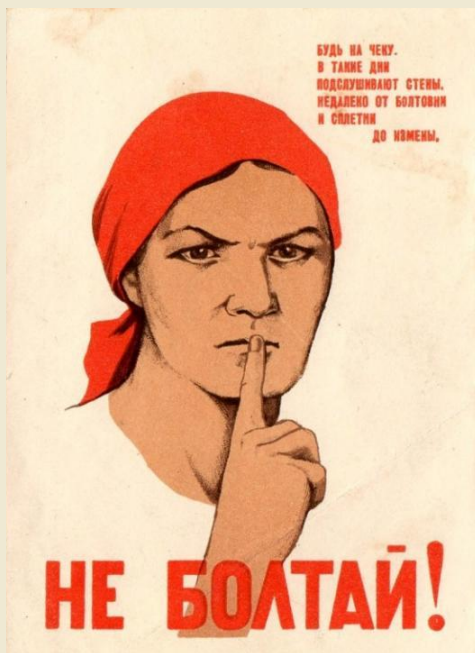
Ватолина Н. и Денисов Н. «Не болтай!»

С первых дней войны в плакат прочно вошла тема бдительности. В июне 1941 года был исполнен плакат «Не болтай!», который, благодаря лаконизму изображения и лозунга, стал вершиной пропаганды актуальной темы и на многие десятилетия пережил время своего создания. Тогда же настоящим народным фольклором стал лозунг: «Болтун - находка для шпиона!».