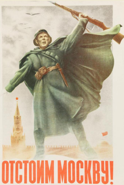
Жуков Н. и Климашин В. «Отстоим Москву!»

Суровые испытания выпали на долю защитников Москвы осенью 1941. В эти дни был создан плакат Н. Жукова и В.Климашина «Отстоим Москву!». Плакат создан в то время, когда советский народ напрягал все силы в борьбе против немецких захватчиков, рвавшихся к Москве. На плакате изображен советский воин, находящийся на высоком эмоциональном подъёме и призывающий не допустить врага в столицу. Этой фигурой солдата авторам удалось обобщить черты народного героизма, стремящегося освободить родную землю от врага.