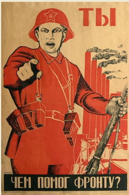
Моор Д. «Ты чем помог фронту?»

Это очень эмоциональный плакат, выполнен в красно-черных красках с изображением воина Красной Армии, обращающегося к зрителю.