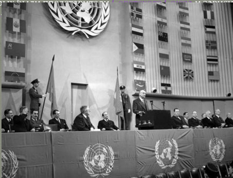
Сессия Ассамблеи ООН, на которой была одобрена Всеобщая декларация прав человека (UNHR)