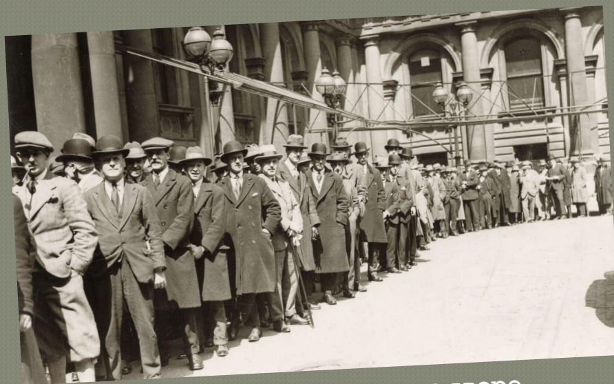
Длинная очередь мужчин во дворе министерства иностранных дел для того, чтобы зарегистрироваться в качестве волонтера во время забастовки