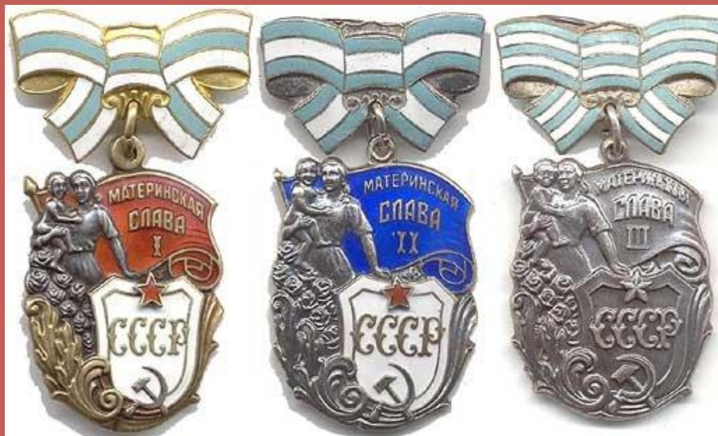
Ордена 1,2,3 степени

Стать многодетной матерью в наше время редкость и своеобразный подвиг.