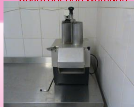
Протирочно- резательная машина