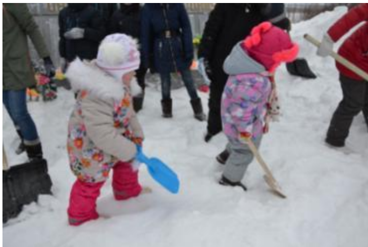
Республиканская акция «Памятник землякам»