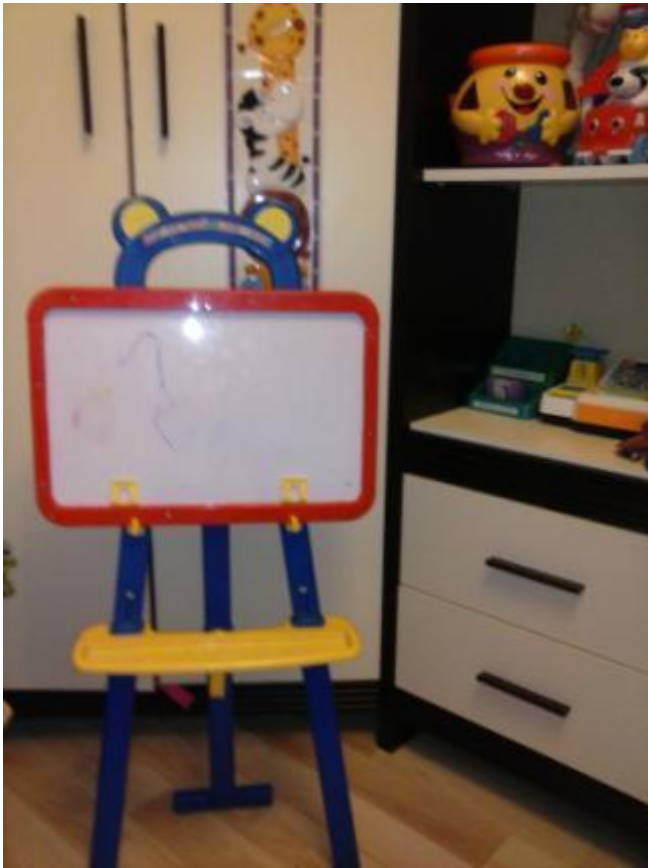
Магнитная доска (для магнит. карточек, букв и цифр)