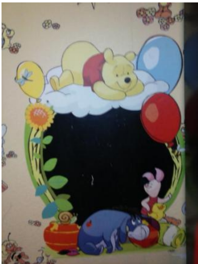
Панно для рисования (можно использовать ватман, кусок обоев)