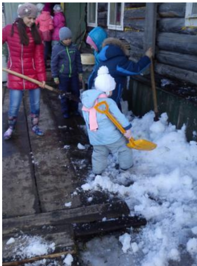
Акция волонтеров «Делай добро»