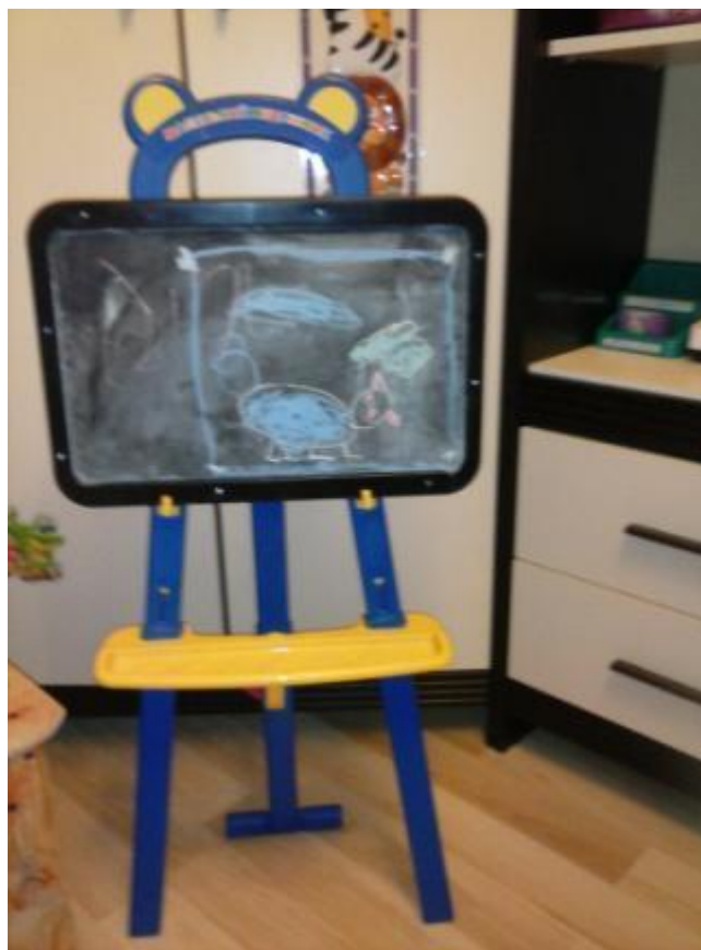
Специальная доска для рисования