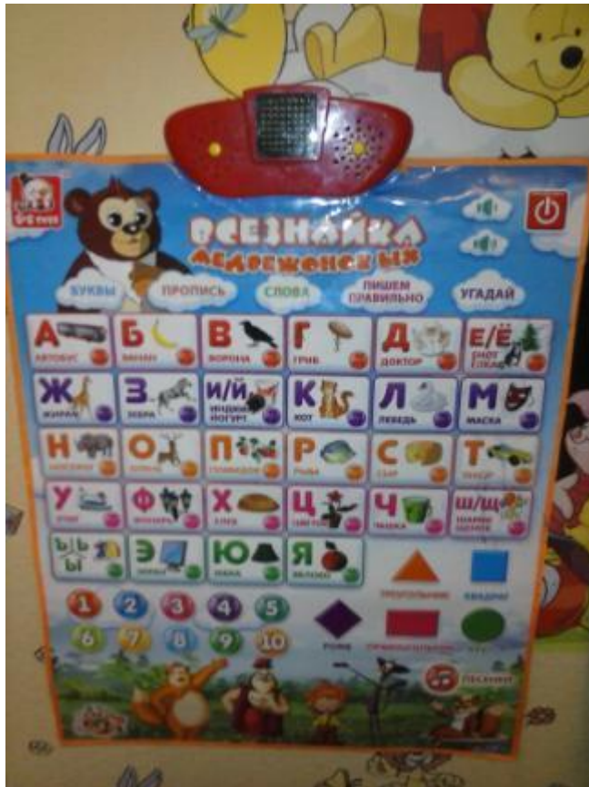
Самоучитель по азбуке и математике