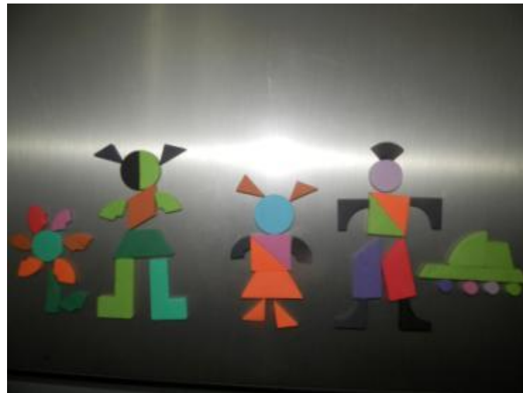
Творчество «Создаем картину из геометрических фигур»