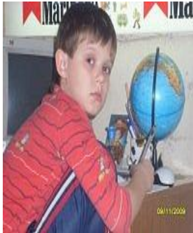
Маленький Сева изучает географию