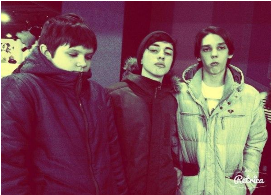
Сева и друзья