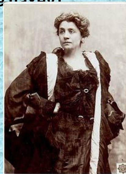
ELEONORA DUSE. Amélie Dupont 571 Fifth Avenue, NEW YORK.