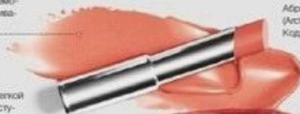
Абрикосовый мусс (Arctic Apricot) Код 081772