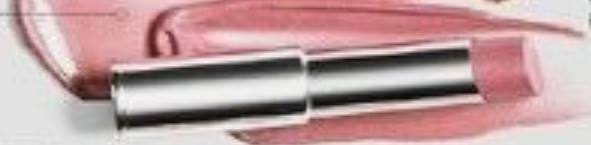
Розовый шик (Posh Pink) Код 081773

Новая помада – это текстура и легкость оттенка блеска для губ в упаковке роскошной помады. Меньшее количество пигментов позволяет сохранять естественный цвет губ.