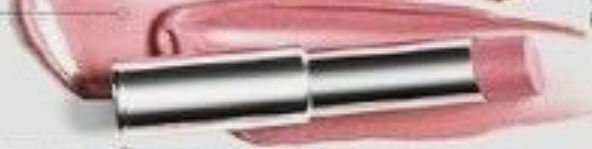
Розовый шик (Posh Pink) Код 081773

Новая помада – это текстура и легкость оттенка блеска для губ в упаковке роскошной помады. Меньшее количество пигментов позволяет сохранять естественный цвет губ.