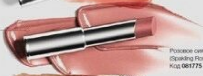
Розовое сияние (Speaking Rose) Код 081775