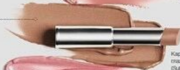
Карамельная глазурь (Subby You) Код 081776