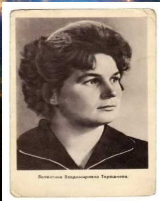
Валентина Владимировна Терешкова.