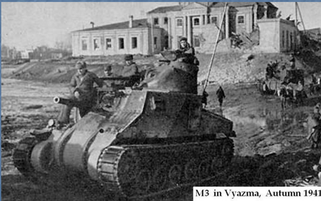
M3 in Vyazma, Autumn 1941