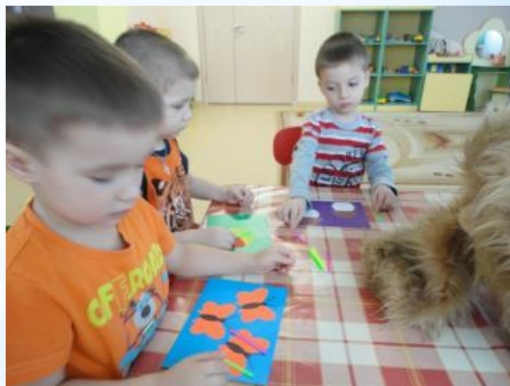
Игра: «Веселые картинки»