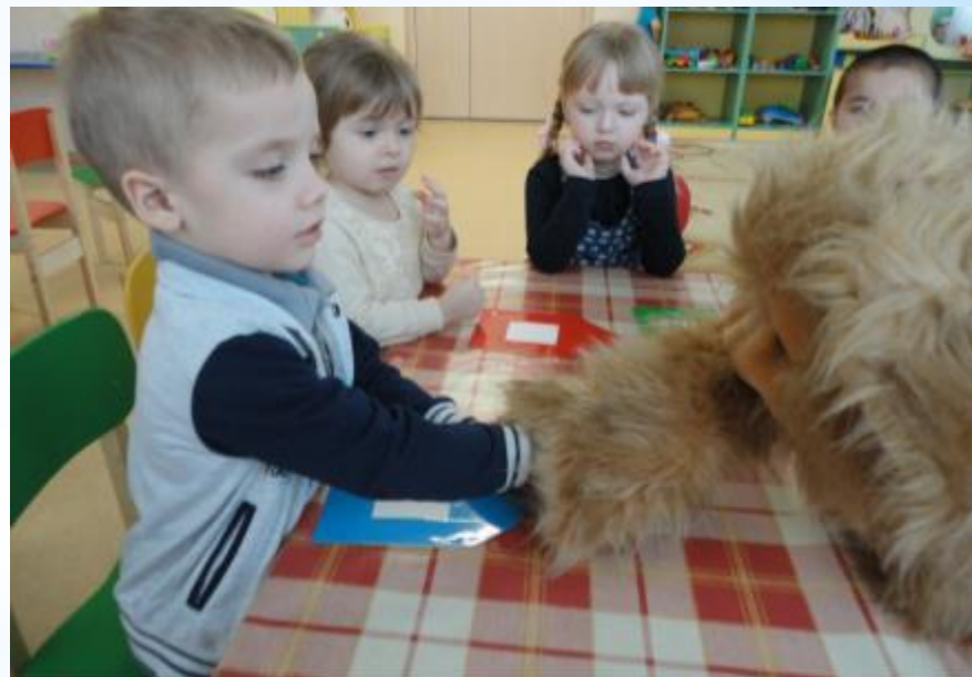
Игра: Гномики и домики»