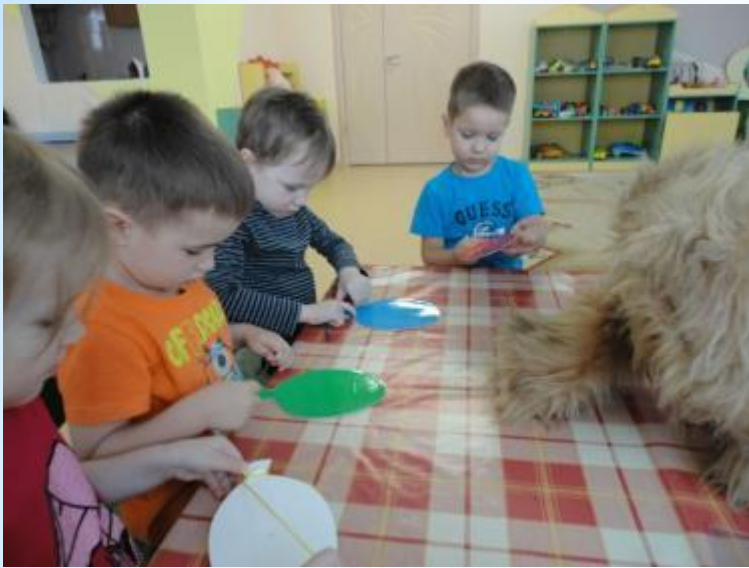
Игра: «Завяжи шарик»