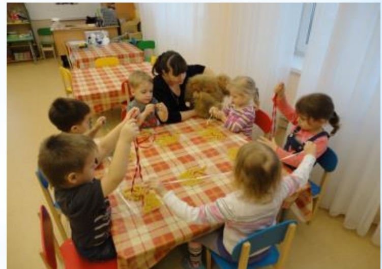
Игра: «Бусы для мамочки»