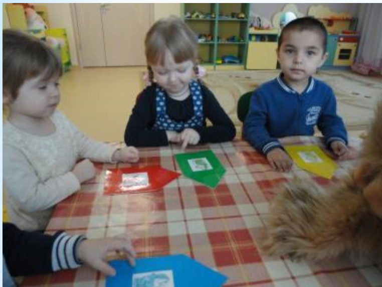
Игра: «Найди свой ДОМ»