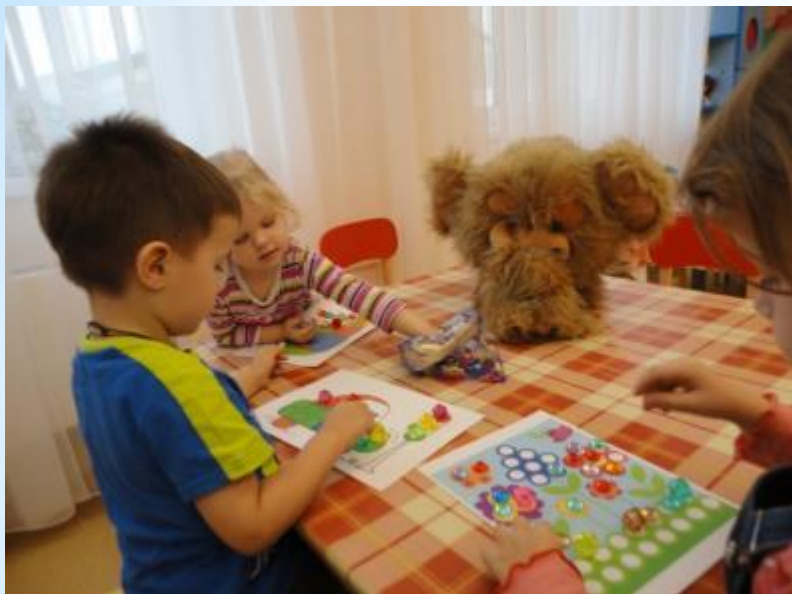
Игра: «Цветные камешки»