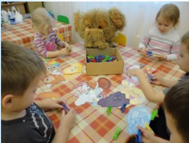
Игра: Цветные прищепки»