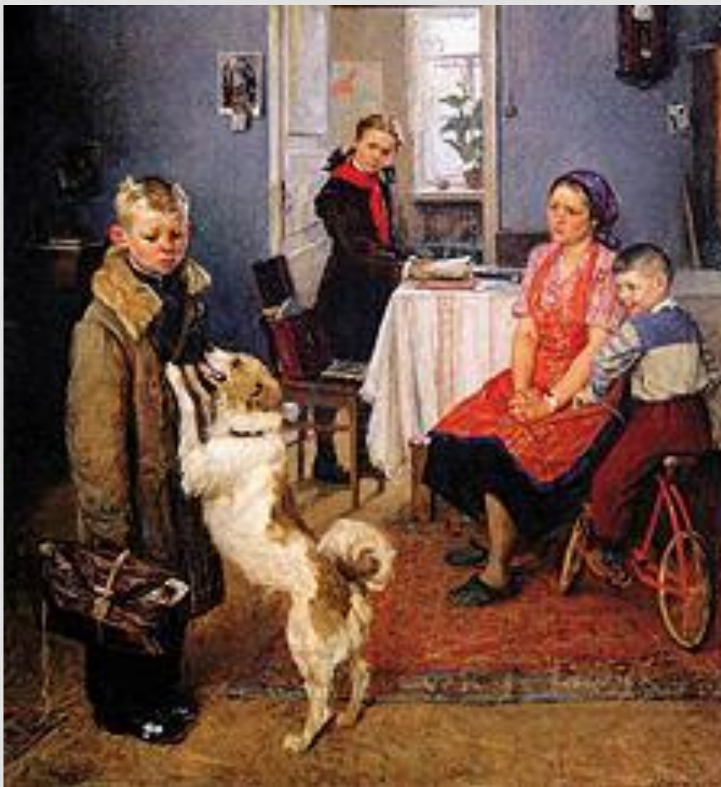
Ф. П. Решетников. «Опять двойка»

Попробуйте нарисовать финал данной картины, но с позиции сегодняшнего дня.