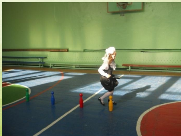
«Посвящение в первоклассники»