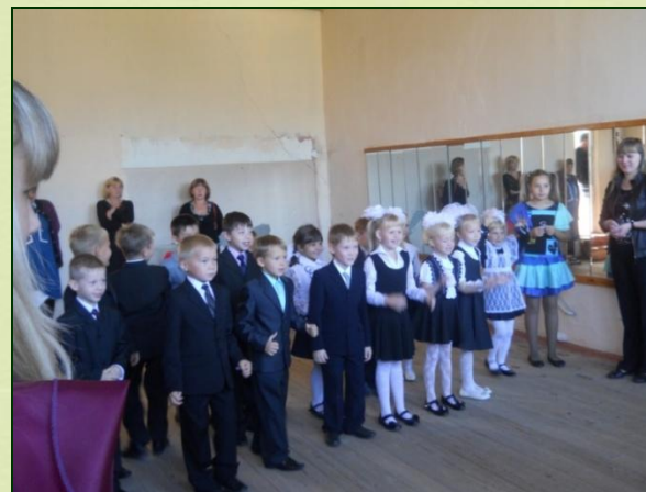
Игра «Тропинка здоровья»