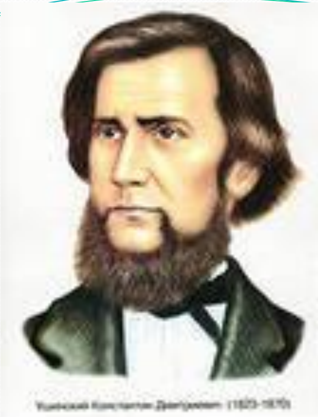
Ушинский Константин Дмитриевич (1823-1870)

Читать – это еще ничего не значит; что читать и как понимать – вот в чем главное дело.