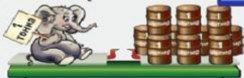
ТАБЛИЦА МЕР ВЕСА