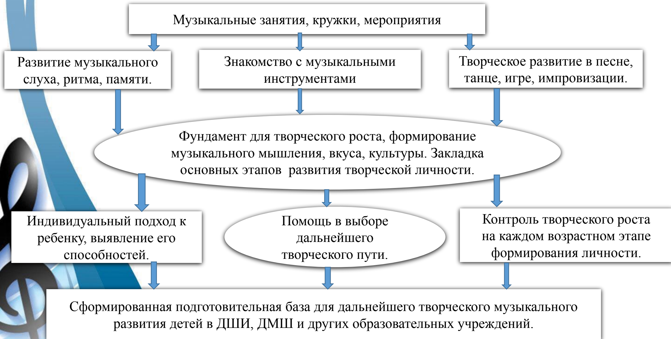
Схема развития музыкальных способностей