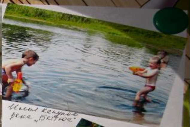
Мелка Калужа Река "Белая"