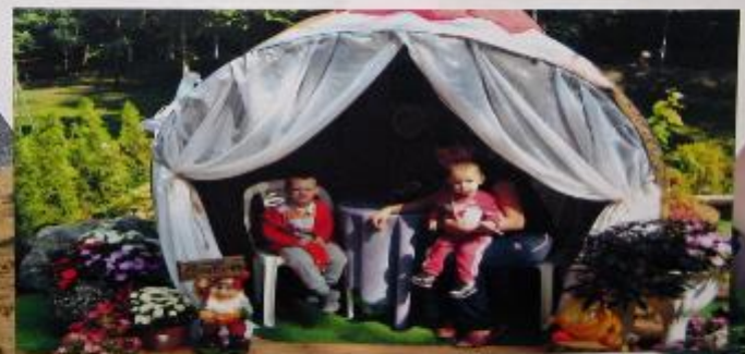
Мелка Калужа "Среди цветов"