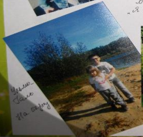
Ублес Саво На берегу