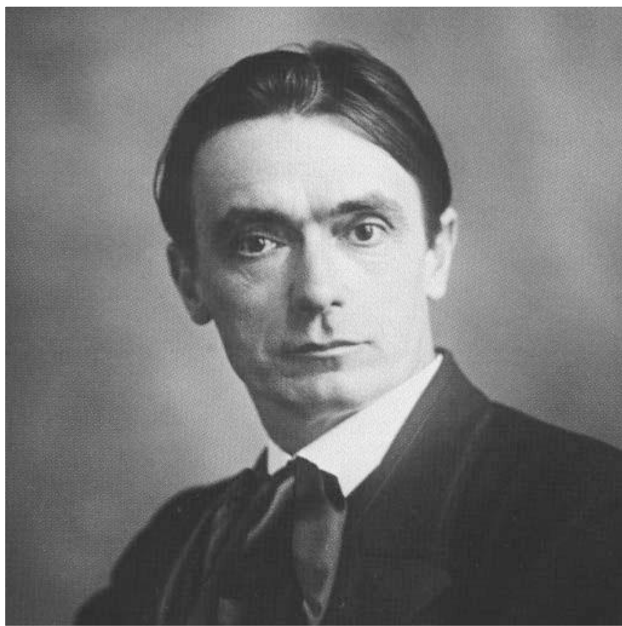
РУДОЛЬФ ШТАЙНЕР (1861-1925)

Продолжая традиции фрёбелевской дидактики, австрийский философ и педагог Р. Штайнер