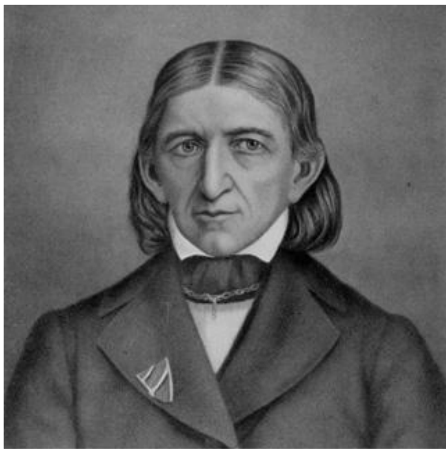
ФРИДРИХ ФРЁБЕЛЬ (1782-1852)

Значительный интерес в Англии вызывает педагогическое наследие Ф. Фрёбеля.