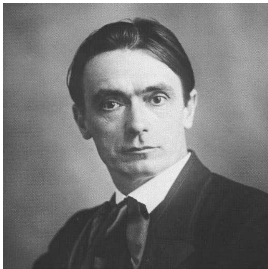
РУДОЛЬФ ШТАЙНЕР (1861-1925)

Продолжая традиции фрёбелевской дидактики, австрийский философ и педагог Р. Штайнер