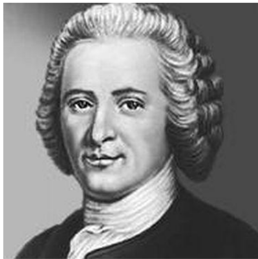
ЖАН-ЖАК РУССО ((1712-1778))

Так же выделим французского писателя и философа Жана-Жака Руссо, который считал, что процесс развития считается биологически и генетически предопределенным, человеческие знания, умения и навыки уже «встроены» в структуру организма. Приоритет отводится естественному развитию ребенка. Хотя окружающая среда и воздействует на развитие, оно во многом ограничено заложенными от природы возможностями. Ребенок занимает ведущую позицию в собственном учении, взрослый выполняет функцию организатора.