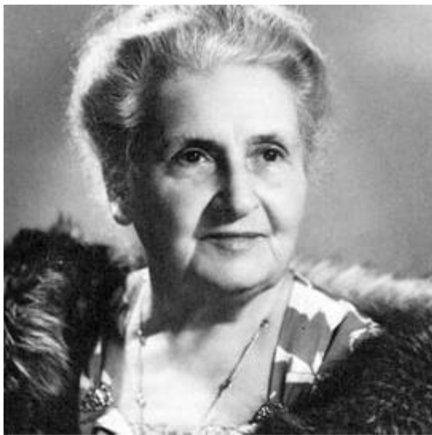
МАРИЯ МОНТЕССОРИ (1869-1952)

Немаловажное, хотя и довольно противоречивое влияние на формирование концепции английского дошкольного образования оказали взгляды Марии Монтессори.