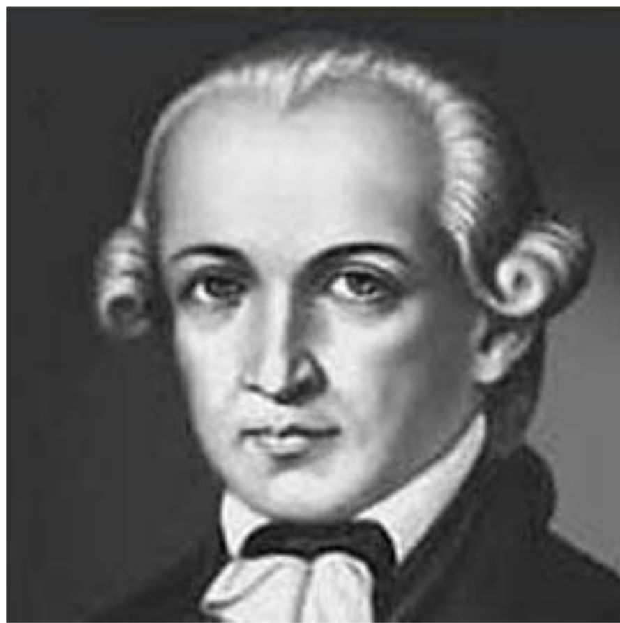
ИММАНУИЛ КАНТ (1724—1804)

Суть еще одного подхода, ведет начало от немецкого философа Иммануила Канта , он рассматривает развитие ребенка не только как созревание и разворачивание определенных биологических и психологических структур, заложенных с рождения, но и как процесс и результат взаимодействия с окружающей средой и людьми.