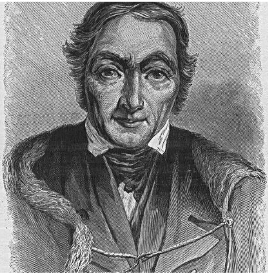
РОБЕРТ ОУЭН (1771-1858)

Английский философ и педагог Роберт Оуэн стоял у истоков английского общественного дошкольного воспитания. Цель воспитания он видел во всестороннем развитии и формировании характера ребенка, а не простом сообщении ему определенного набора знаний. Одной из ведущих задач он считал нравственное воспитание. В отборе образовательного содержания Р. Оуэн предлагал ориентироваться на детские возможности и интересы и строить работу дошкольного учреждения вокруг индивидуальных и групповых видов деятельности, не навязывая подопечным определенного занятия. Следует признать, что высказывания Р. Оуэна до сих пор актуальны для английской дошкольной педагогики.