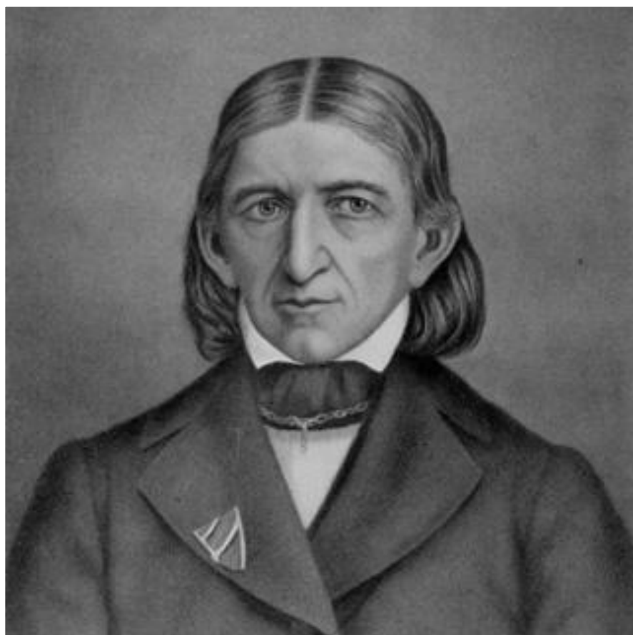
ФРИДРИХ ФРЁБЕЛЬ (1782-1852)

Значительный интерес в Англии вызывает педагогическое наследие Ф. Фрёбеля.