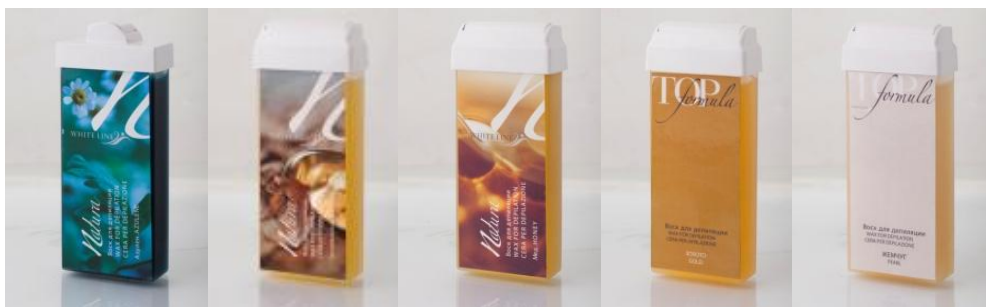
Азулен Жемчужный Мед Натуральный Золотой Formula