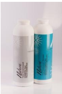
Тальк косметический с ментолом