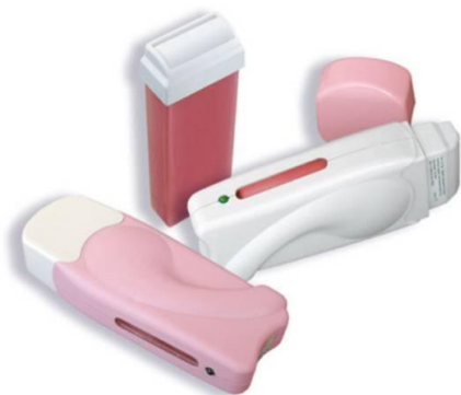
Подогреватель для картриджа "Lady V"