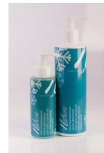
Гель охлаждающий после депиляции