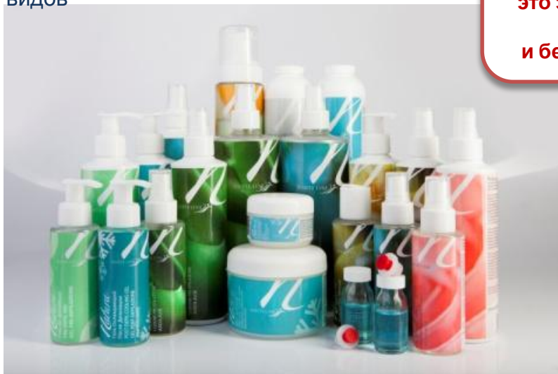
Средства перед депиляцией - 6 видов Средства после депиляции - 5 видов Специальные ухаживающие средства

Депиляция с WHITE LINE NATURA – это эффективное удаление волос и бережный уход за кожей.