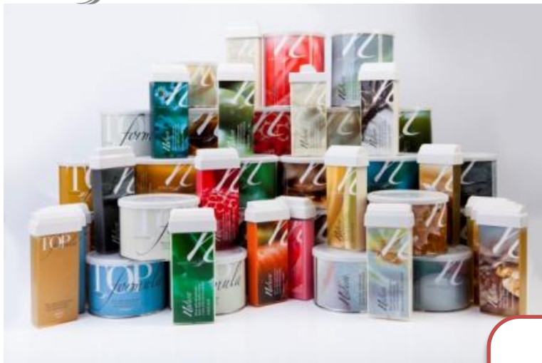
Теплый воск в картриджах и банках – 15 видов