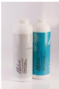
Тальк косметический с ментолом