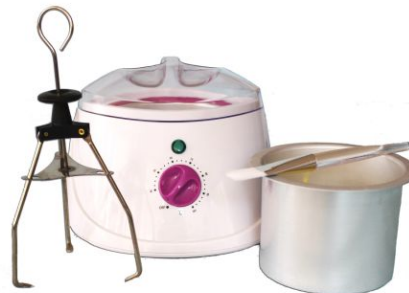
Подогреватель для воска и парафина "Yorkma"