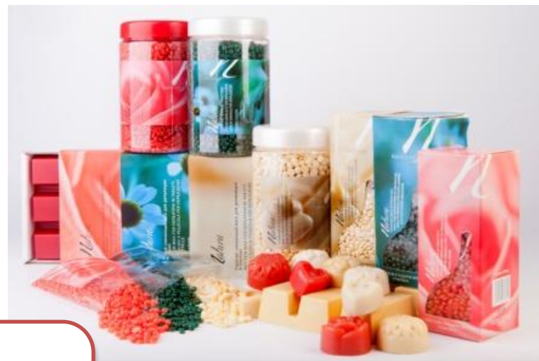
Горячий пленочный воск 3-х видов в различной упаковке и форме выпуска

Депиляция с WHITE LINE NATURA – это эффективное удаление волос и бережный уход за кожей.