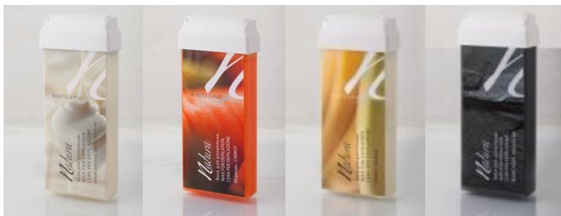
Белый шоколад Морковь* Банан** Для мужчин