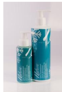
Гель охлаждающий после депиляции