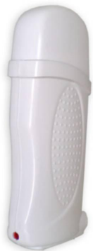
Подогреватель для картриджа