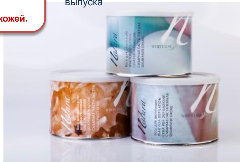
Сахарная паста для шугаринга