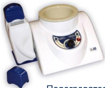
Подогреватель для 1 банки и 2 картриджей

Расходные материалы для депиляции WHITE LINE