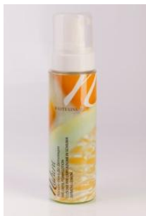
Пена до депиляции