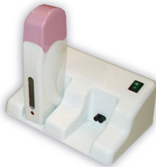
Подогреватель для 2-х картриджей "Basic": база+2 подогревателя