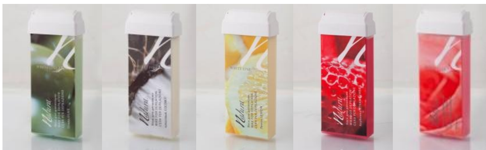
Олива Кокос Лимон Клубника** Роза