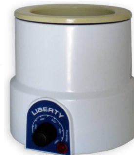
Подогреватель для банок "Liberty"