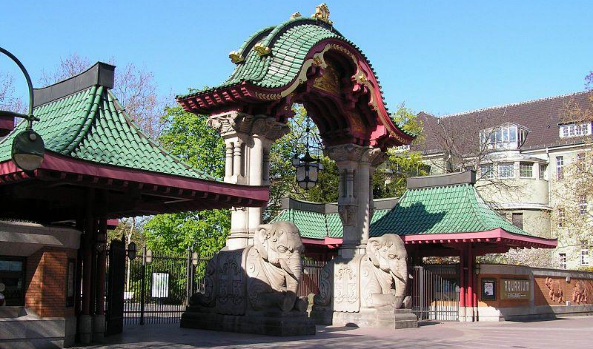
Berliner Zoo Elefantentor