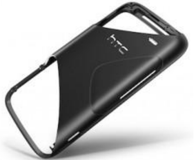
HTC 7 Mozart