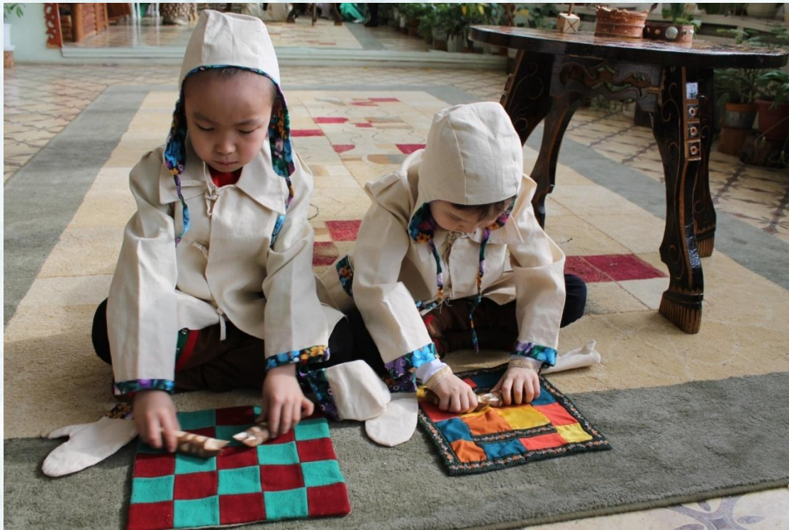
Деревянные коровы - игрушки якутских детей