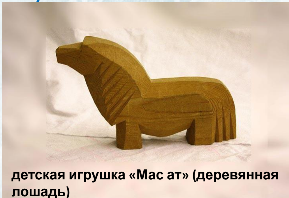
детская игрушка «Мас ат» (деревянная лошадь)