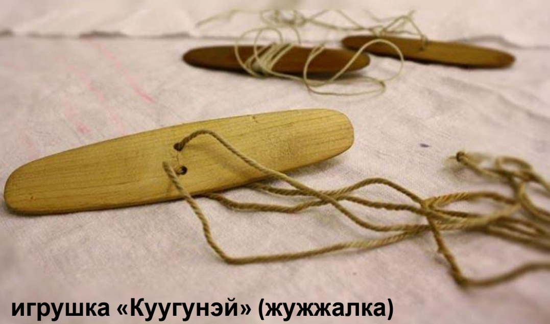
игрушка «Куугунэй» (жужжалка)