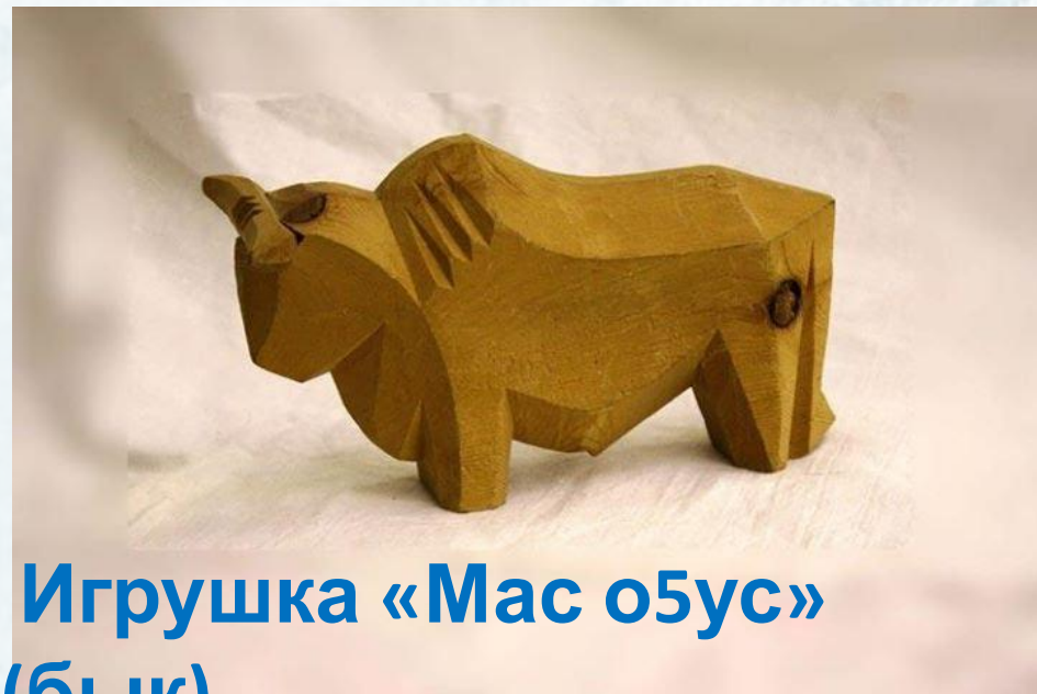
Игрушка «Мас оBus» (бык)