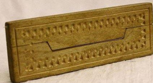
музыкальная игрушка «Чычыгыныыр» (пищалка)