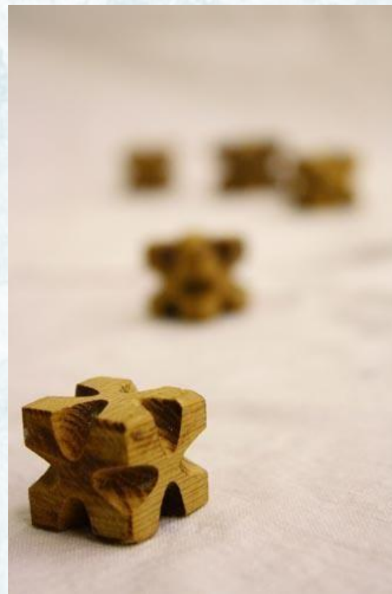
Игра «Хаамыска» (кубики)