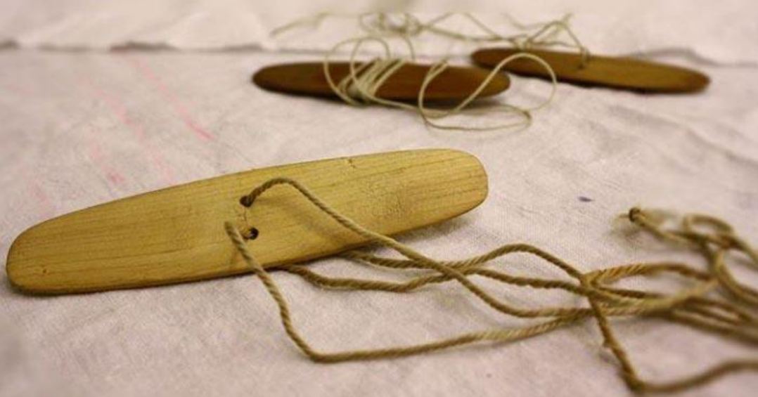
игрушка «Куугунэй» (жужжалка)