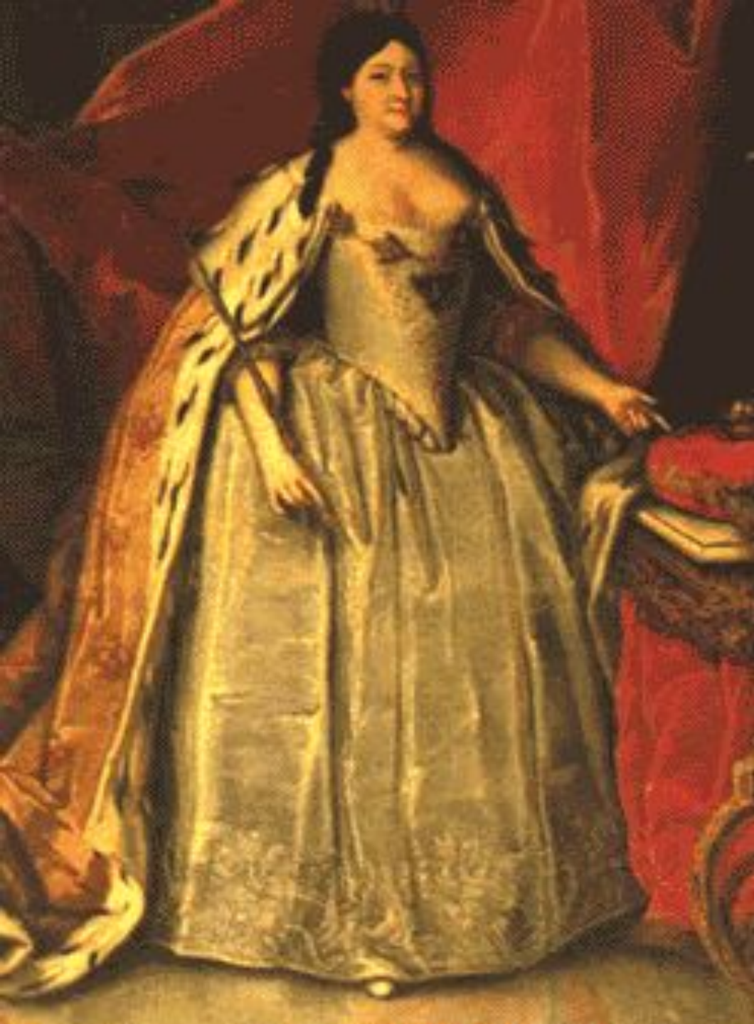
АННА ИОАННОВНА 1730 -- 1740