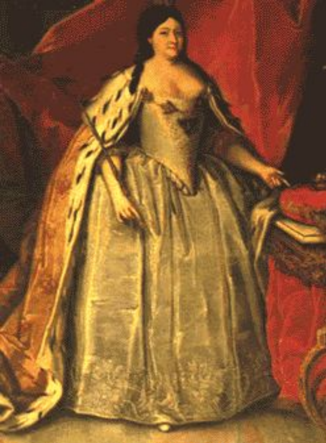
АННА ИОАНОВНА 1730 -- 1740