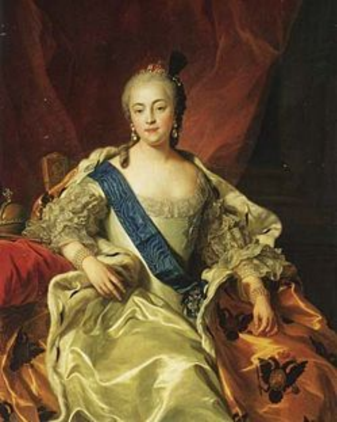
ЕЛИЗАВЕТА ПЕТРОВНА 1741 -- 1761