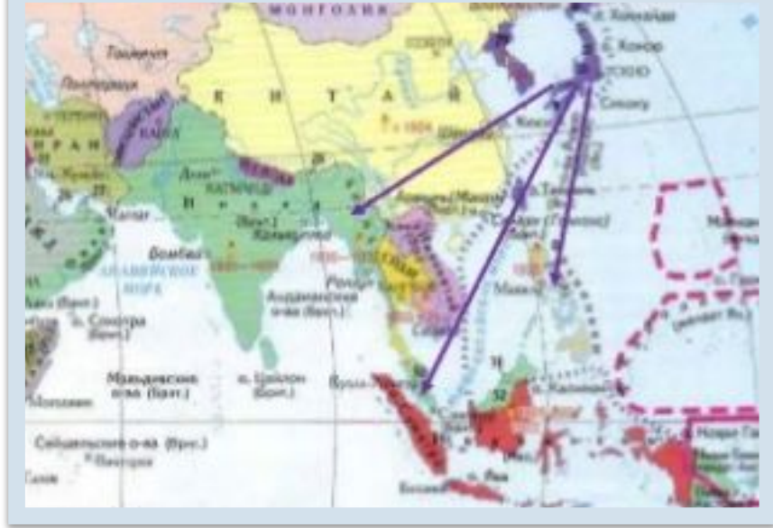
Японская агрессия на Тихом океане

После разгрома Германией, Франции и Голландии в начальный период Второй мировой войны японцы приступили к завоеванию их колоний в Юго-Восточной Азии. Они подчеркнули себе Малайю, Бирму, Таиланд, Филиппины, совершили агрессию против США, напав на Пёрл-Харбор в декабре 1941 г.