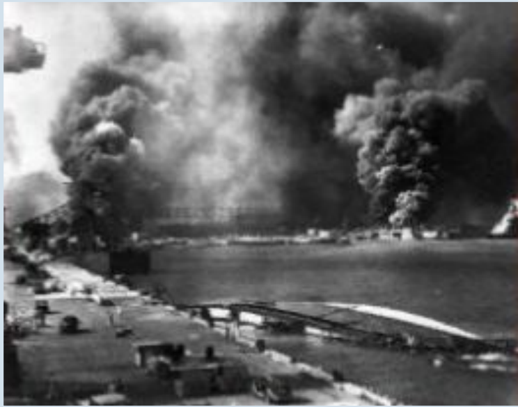
Нападение Японии на Пёрл-Харбор