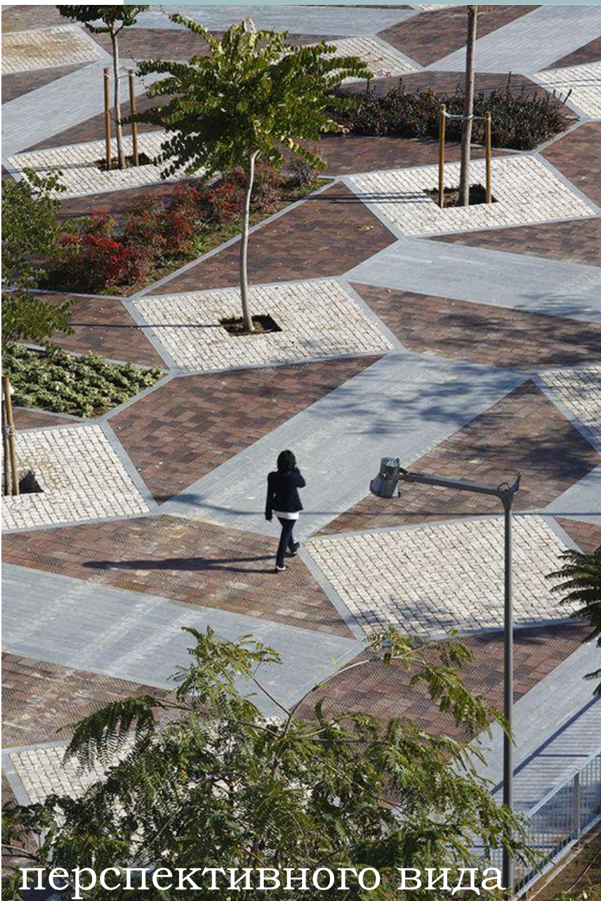
Примеры оформления перспективного вида