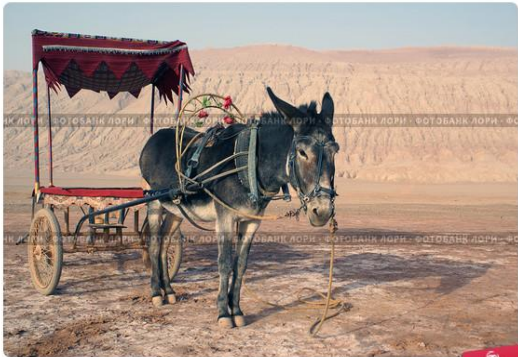
Ослик с тележкой