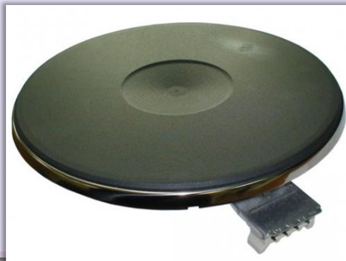
конфорка для электроплиты