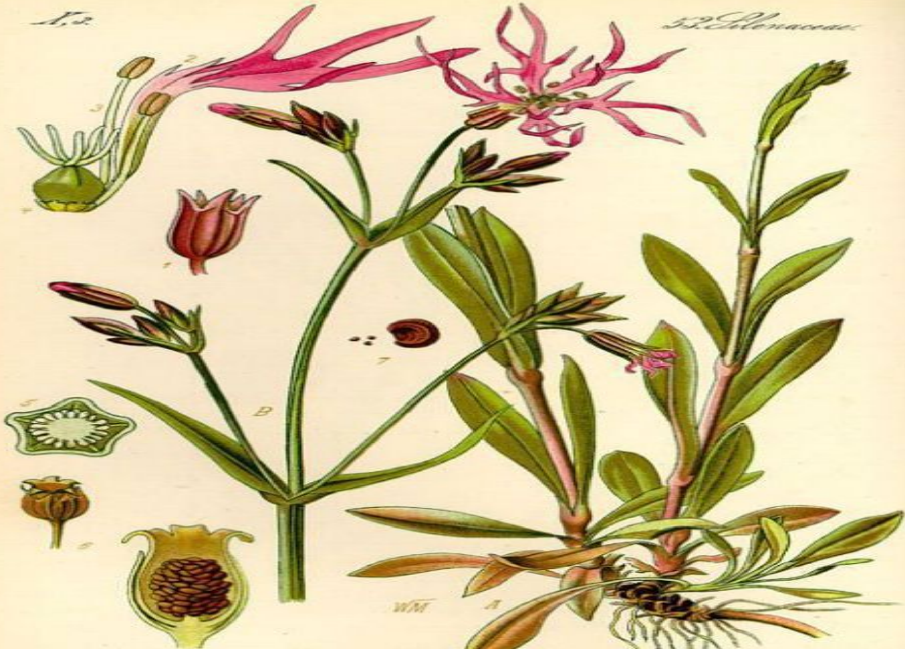
201. Coronaria flos cuculi