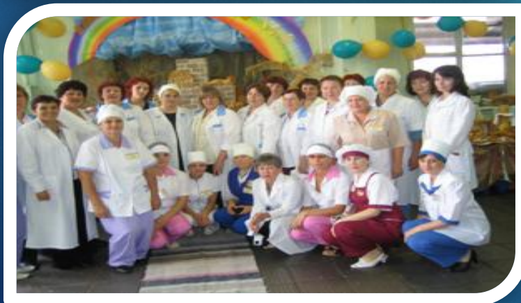
ОАО «Заинский сахарный завод»