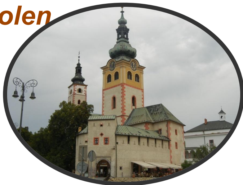
Mestský hrad v Banskej Bystrici