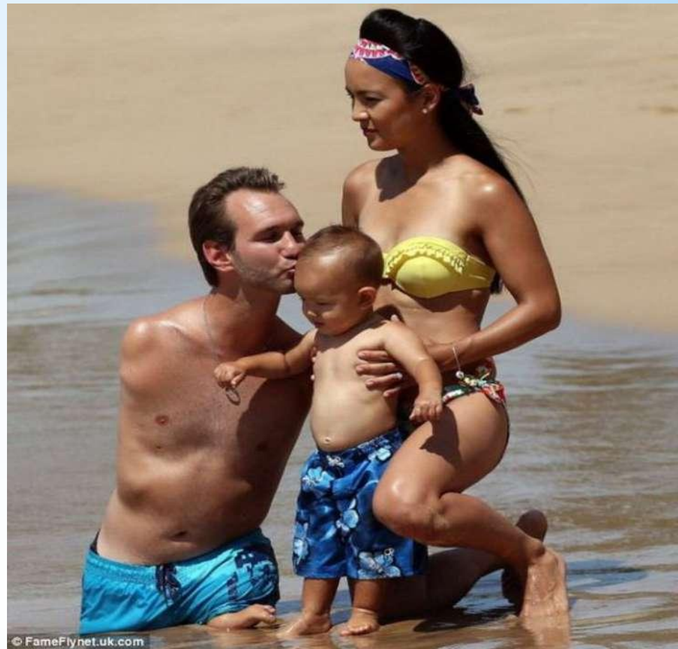
* Ник Вуйчич