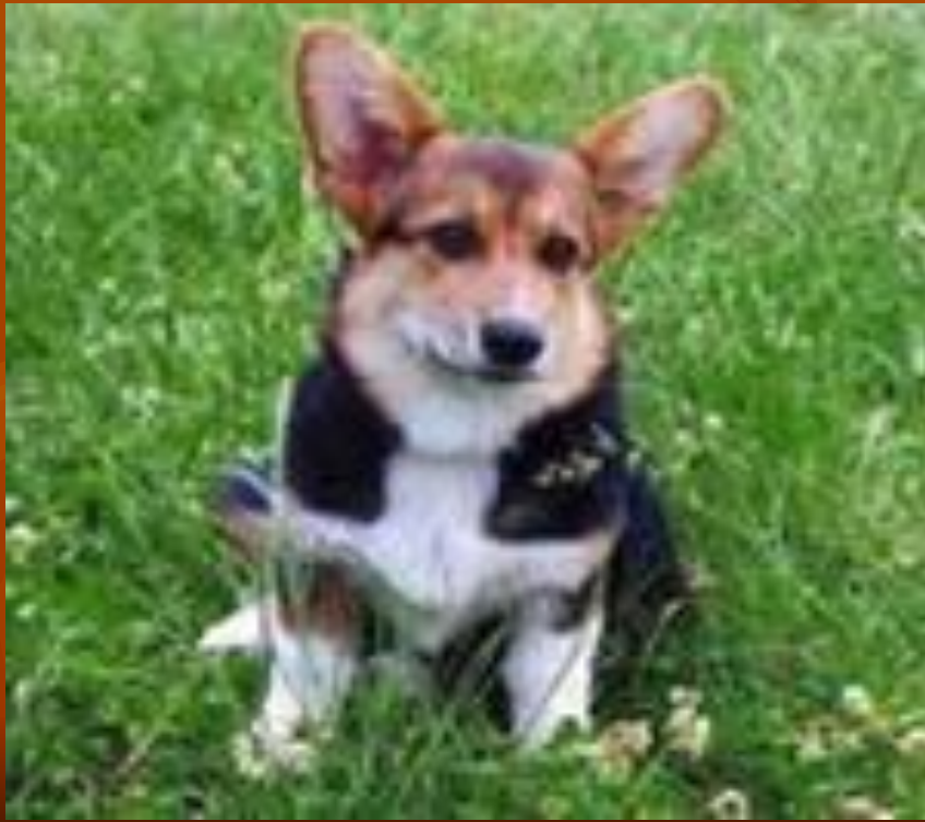
Jip the dog