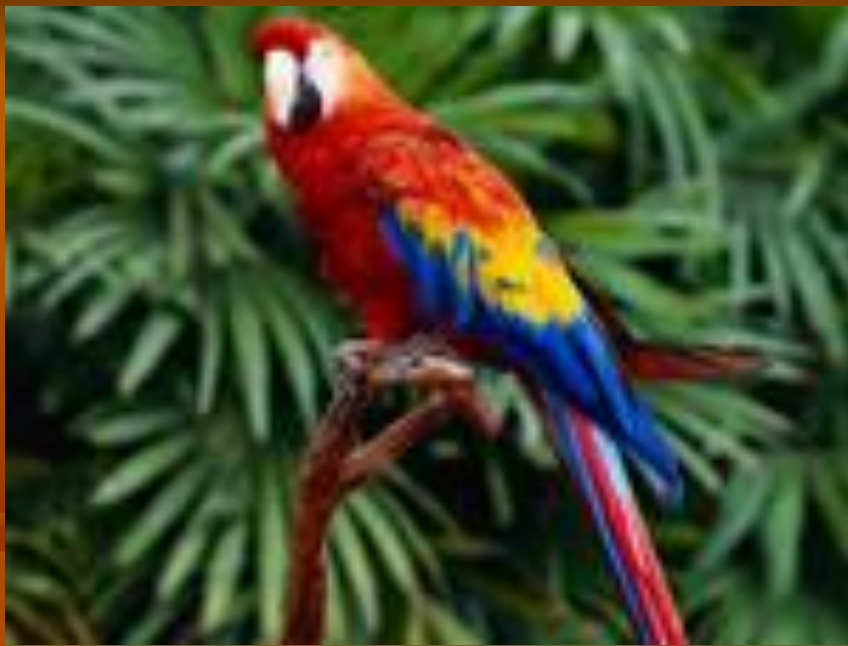
Polynesia the parrot