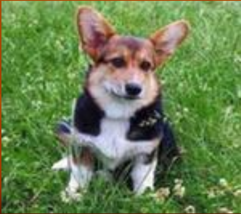
Jip the dog