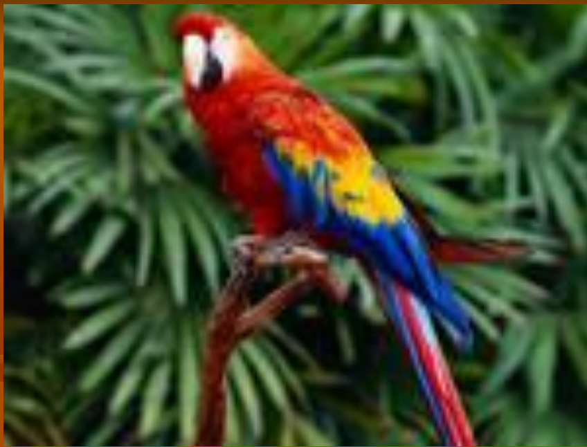
Polynesia the parrot