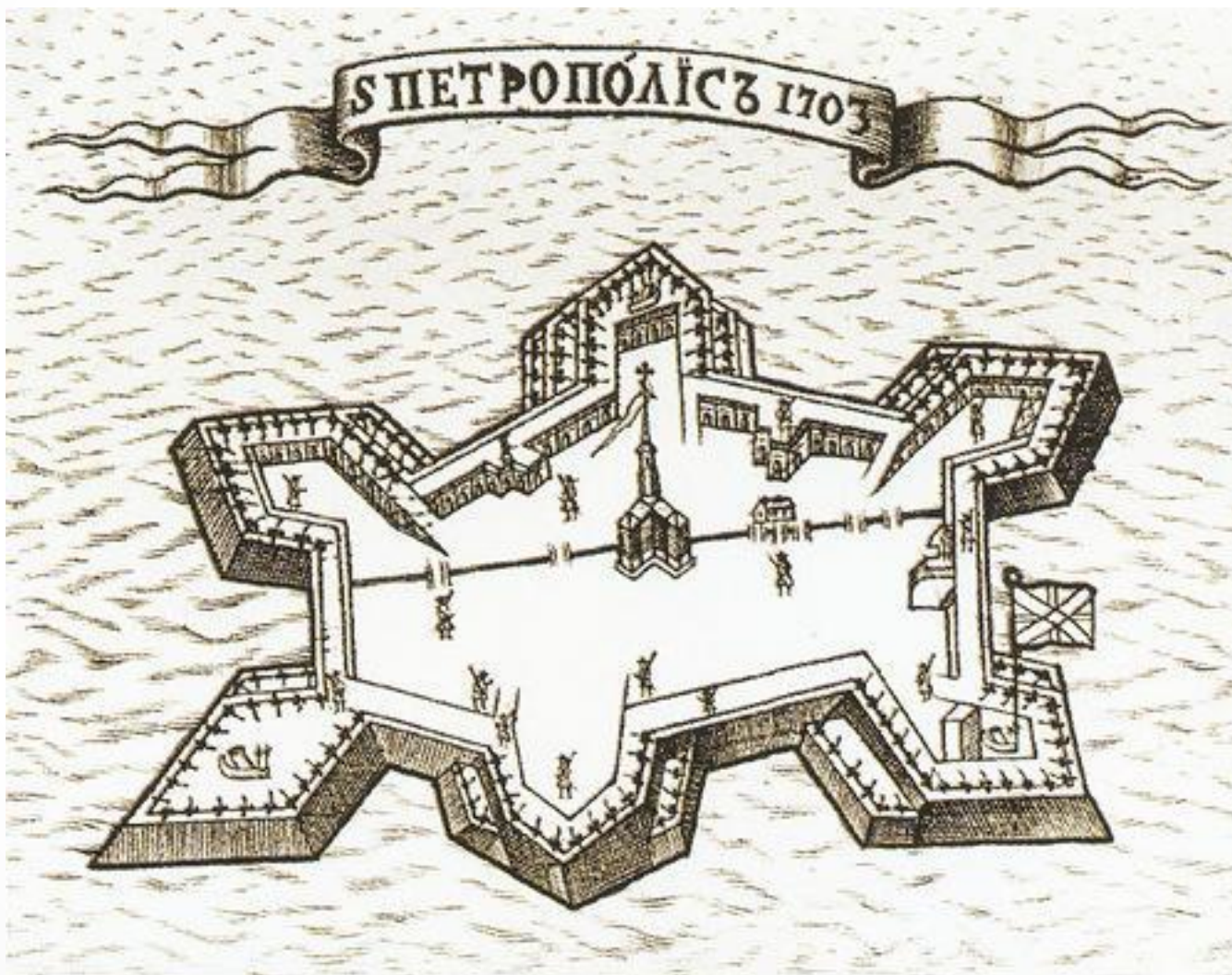
Чертёж был найден в бумагах Петра I. Автор неизвестен