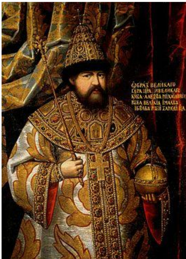
Алексей Михайлович, отец Петра I Петра I