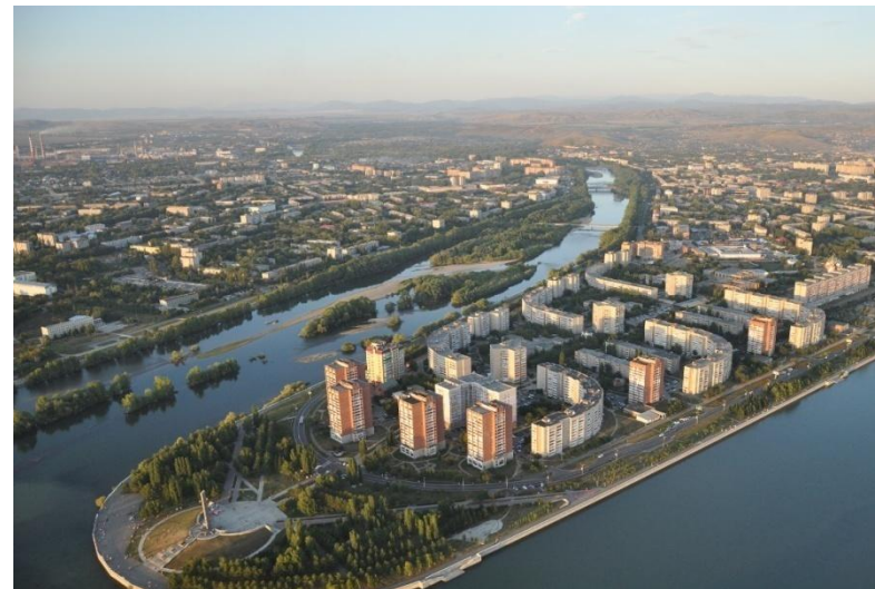
Усть-Каменогорск - административный Центр Восточно-Казахстанской области