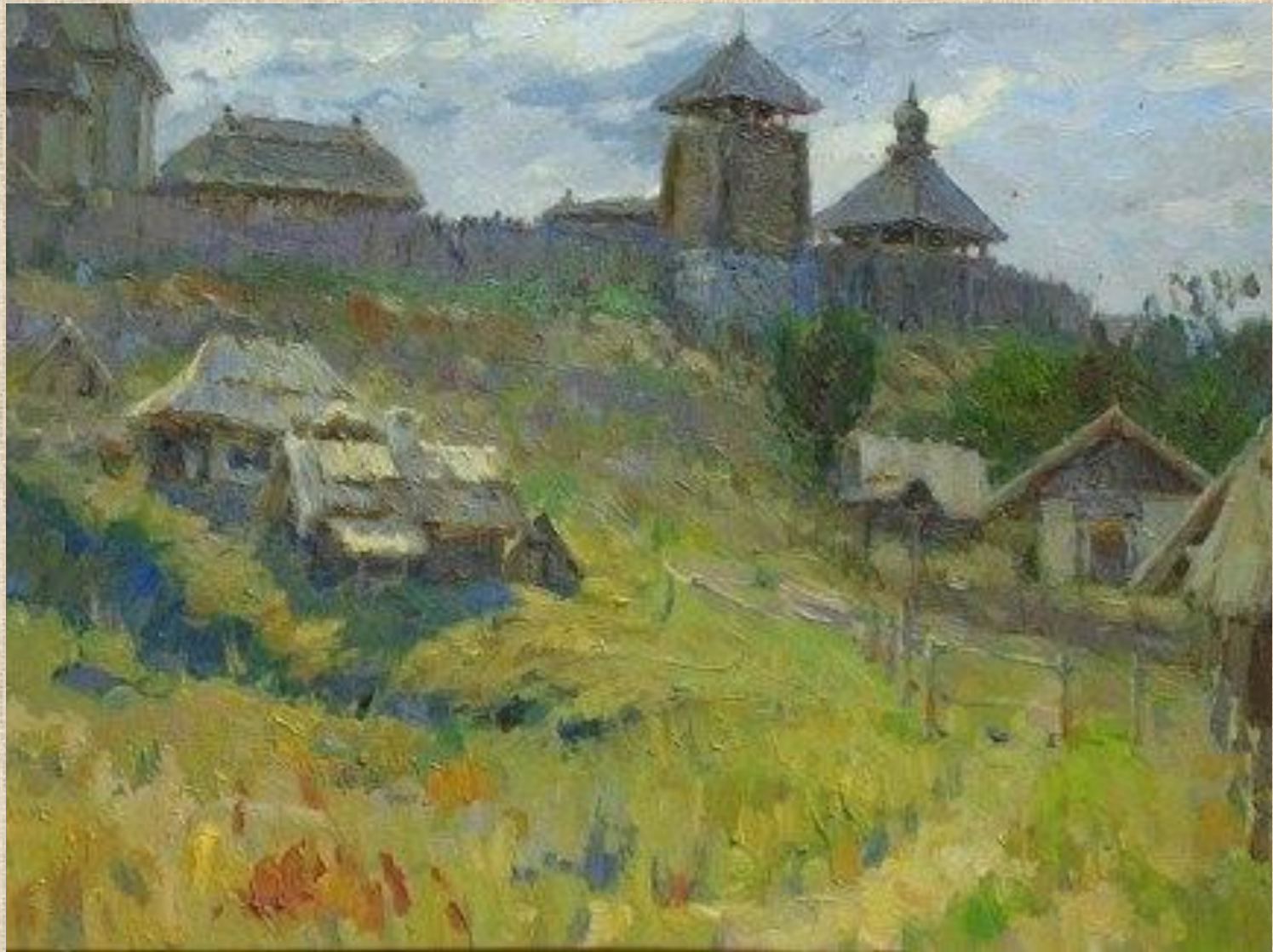
Картина «Запорожская Сечь»