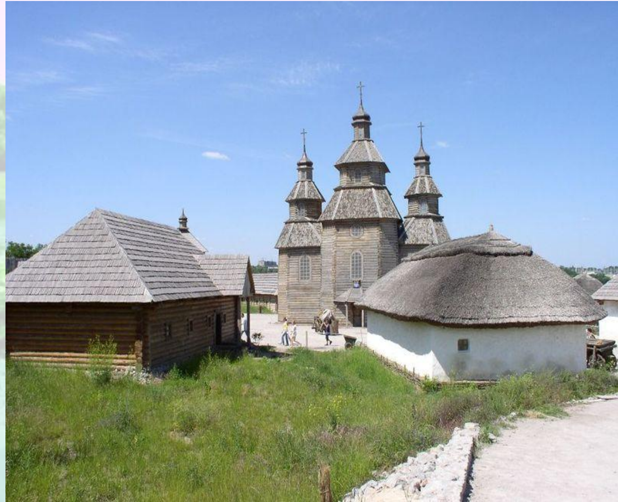
Запорожская Сечь (реконструкция)

Сечь представляла собой укрепление, внутри которого стояли церковь, хозяйственные постройки и жилые помещения (курени). Название места нахождения штаб-квартиры казаков. По мнению исследователей, первая крепость за Днепровскими порогами (т. н. хортицкий замок, прототип Запорожской Сечи) — была построена князем Дмитрием Вишневецким в 1553 году на острове Малая Хортица и просуществовала до 1557 года. В настоящее время этот остров носит имя Байды.