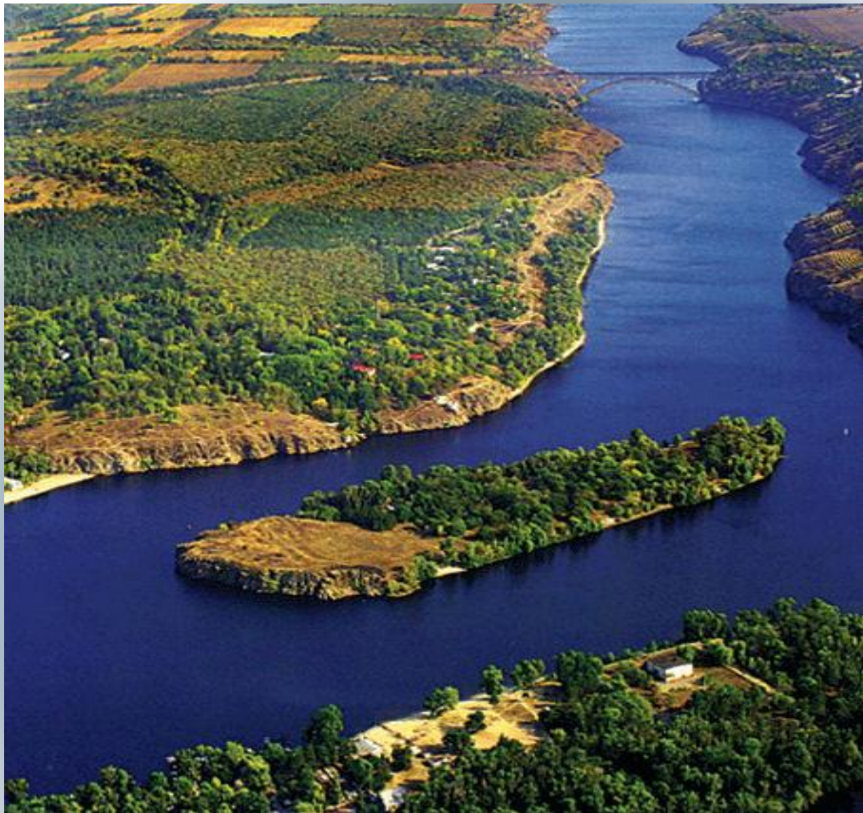
Остров Байда (Малая Хортица)