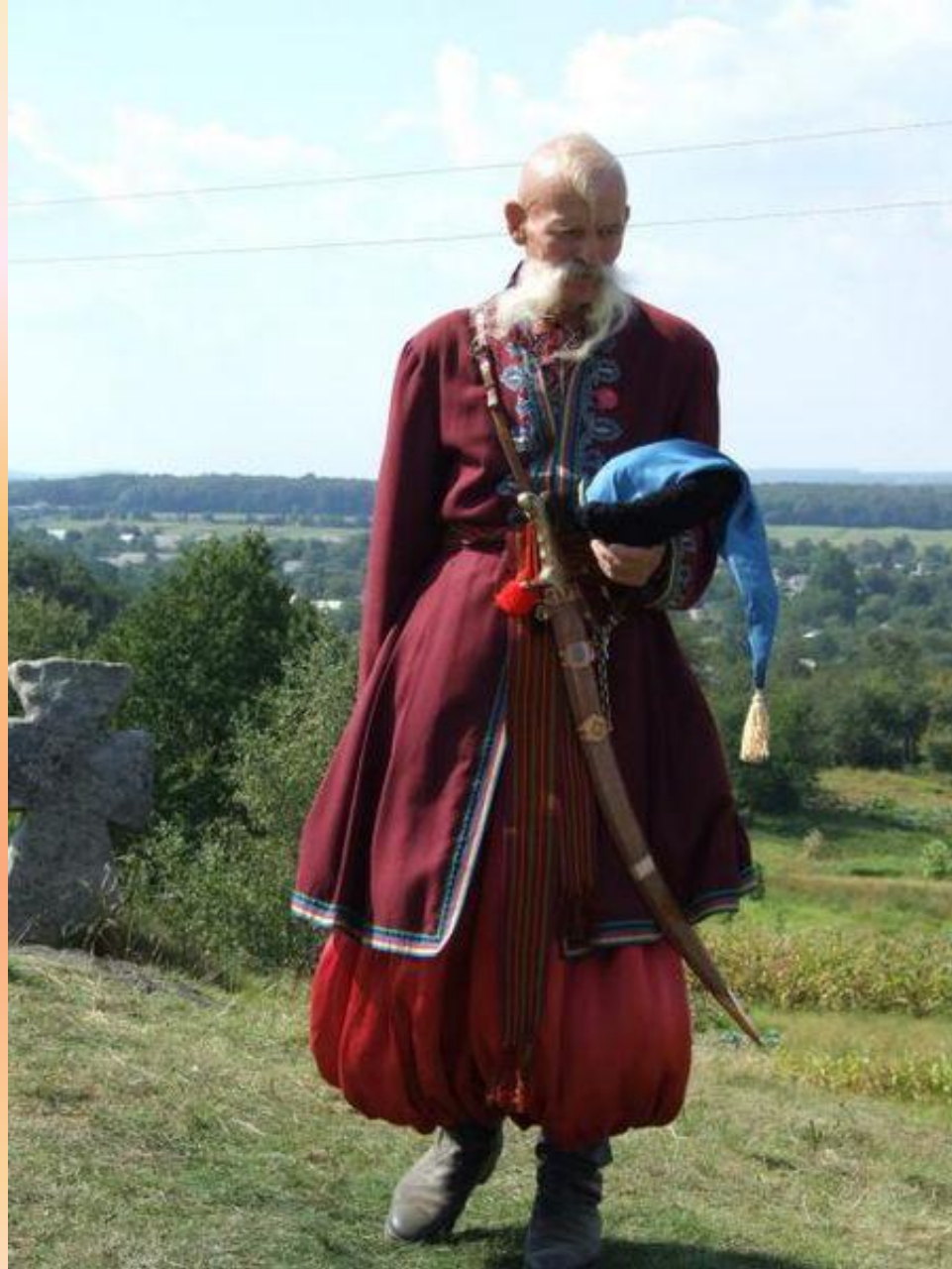
Современная реконструкция костюма казака.