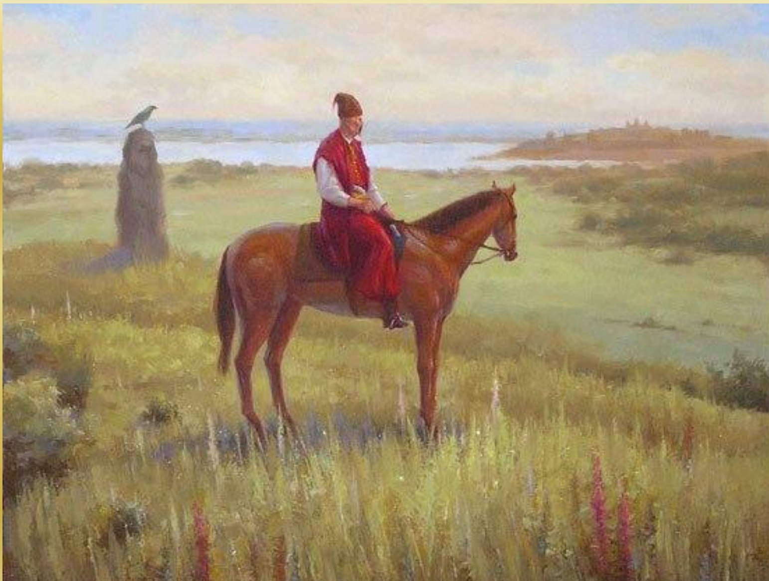
Картина «Дорога на Січ»