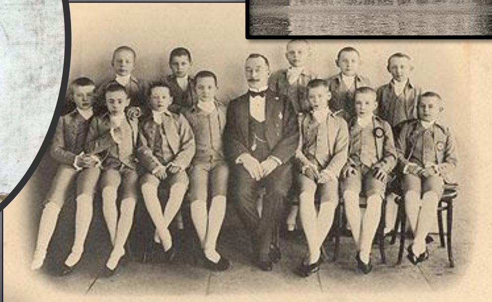
Кадеты II возраста от 6 до 12 летъ (голубые) Императорскаго Сухопутнаго Шляхетнаго кадетскаго корпуса въ царствованіе Императрицы Екатерины II.