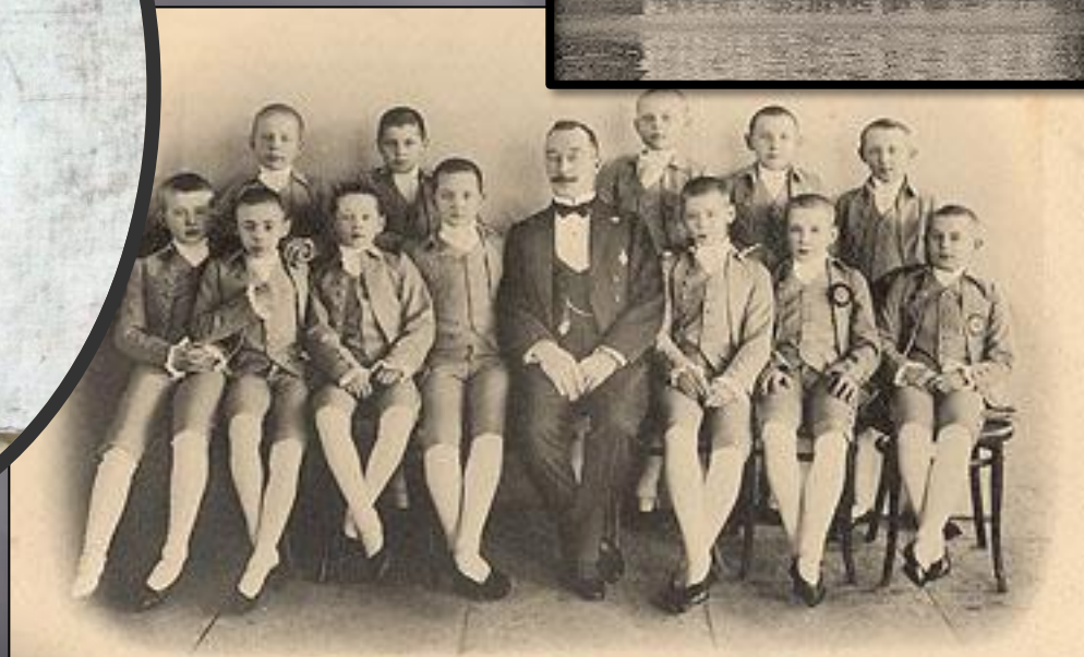
Кадеты II возраста от 6 до 12 летъ (голубые) Императорскаго Сухопутнаго Шляхетнаго кадетскаго корпуса въ царствованіе Императрицы Екатерины II.