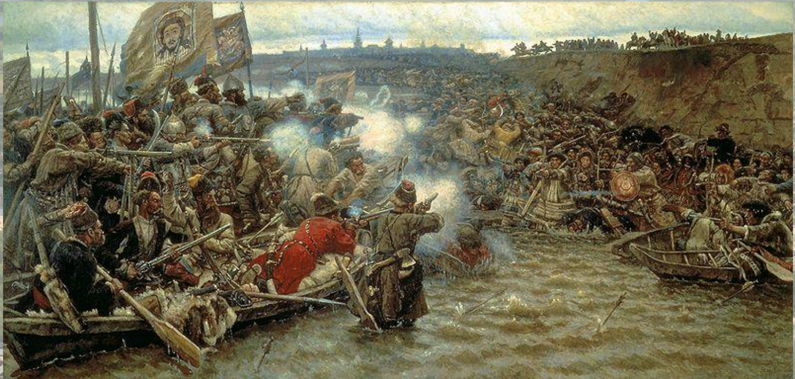
В.И. Суриков «Покорение Сибири Ермаком» 1895 г.