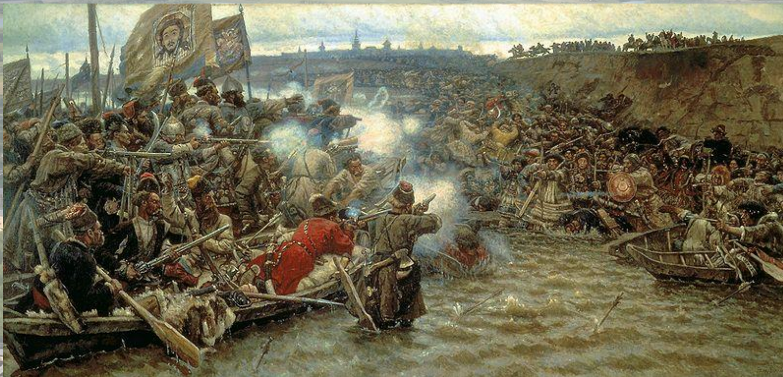
В.И. Суриков «Покорение Сибири Ермаком» 1895 г.