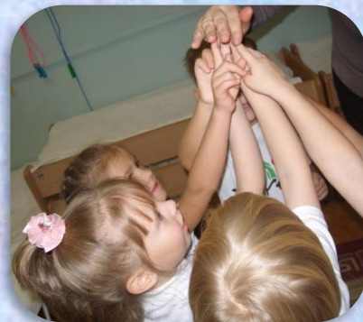
Гимнастика для глаз